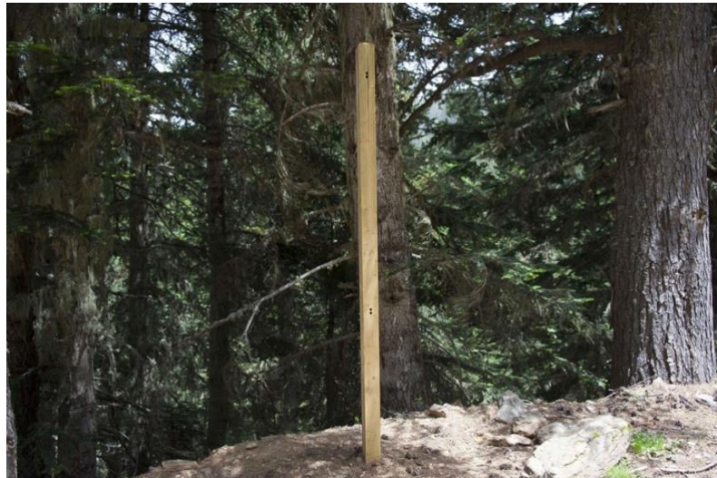
L'écomcompteur pyroélectrique infrarouge à lentille haute précision comptabilise, sur une piste du Canigó, les flux de 4 types d'usages différents — cliché V. Vlès, 2016.

Pour ce faire, la solution technique de l'écomcompteur offre un système de comptage économique éprouvé depuis une vingtaine d'années (tant dans les espaces naturels qu'en milieu urbain) qui transmet les données à distance ; le système est accompagné d'un logiciel d'analyse pour collecter et transcrire les données et d'un système permettant d'éditer de manière simple un rapport (par exemple, par un système à capteurs multiples à la montagne Sainte-Victoire 1 ou par un système pyroélectrique infrarouge multiflux dans le Massif du Canigó 2 ).