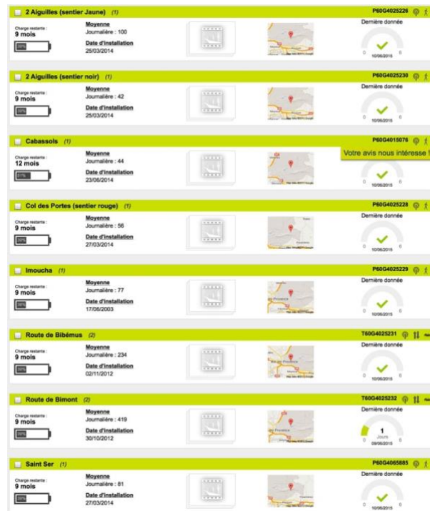
Système d'observation avec réseau d'écompteurs de Sainte-Victoire — capture d'écran V. Vlès, 2016.

observatoire cartographique (SIG), observatoire photographique et observatoire de la fréquentation qui autorisent l'acquisition, le suivi scientifique, la régulation des flux et la valorisation des connaissances acquises sur le site. Cet observatoire permanent assurerait la récolte de données avec une bonne fiabilité et autoriserait la gestion des flux presque en temps réel en estimant en permanence la fréquentation, sa répartition spatiale et temporelle, la saturation des points emblématiques et celle des nœuds de convergence des cheminements sur le site. En outre, il pourrait être présenté sous la forme d'un « tableau de bord », consultable en ligne en accès libre, comme c'est le cas dans le système ouvert de Sainte-Victoire.