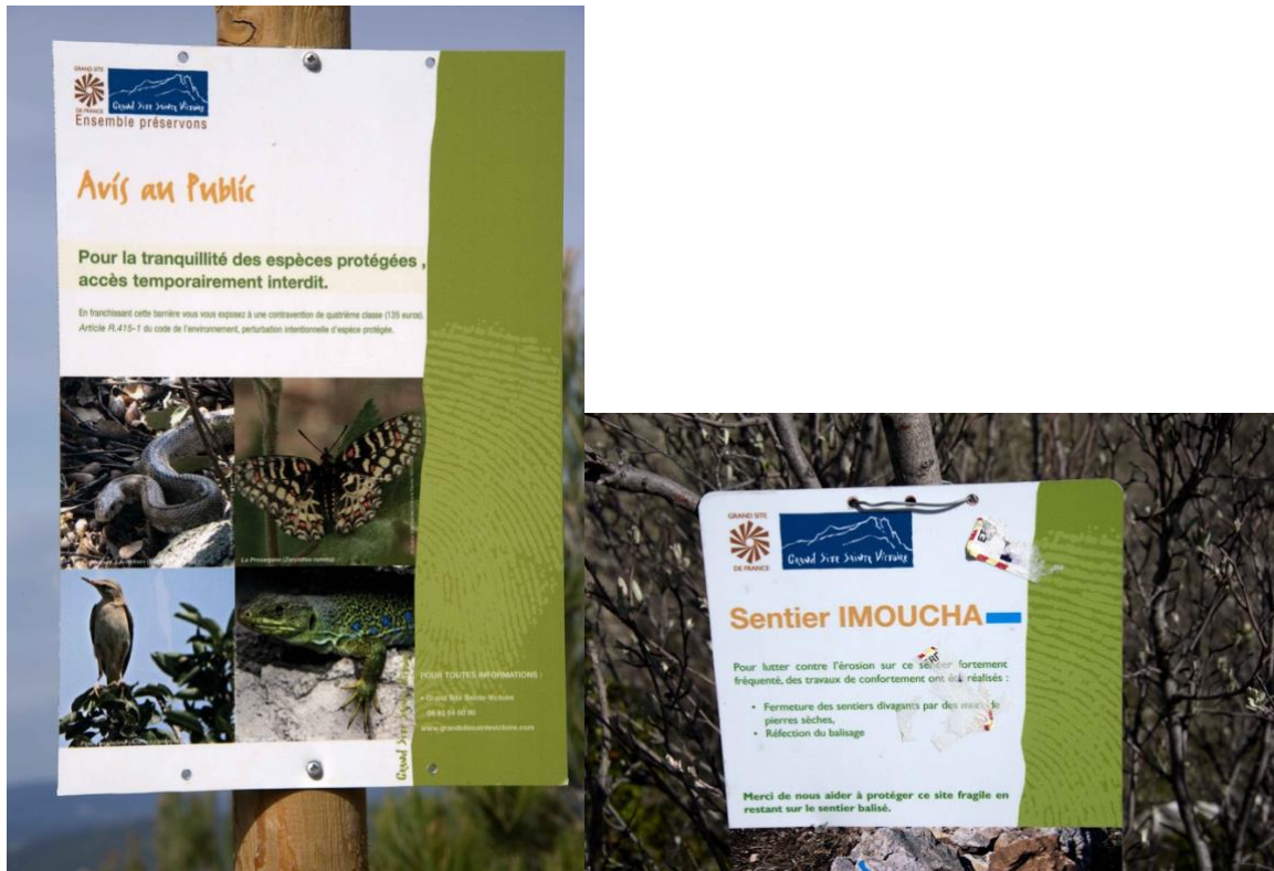
Deux exemples d’accès temporairement fermés à Sainte-Victoire, l’un pour permettre la reproduction d’espèces protégées, l’autre pour lutter contre l’érosion – cliché V. Vlès, 28 avril 2015.

La connaissance générale des fréquentations, calée sur les indicateurs d’évolution du milieu naturel et de protection des espèces (voir dossier 1), gagnerait à être appliquée au cas par cas sur chaque sentier. La capacité d’accueil dépendra donc à chaque occurrence des situations écosystémiques et géographiques de chaque point sensible. L’ouverture et la fermeture de sentiers seront effectuées en fonction de la capacité des écosystèmes à recevoir un type ou plusieurs types de fréquentations à certains moments de l’année.