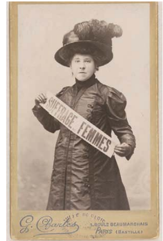
Hubertine Auclert (1848-1914), fémiste française. France, vers 1900. Bibliothèque Marguerite Durand

umana preoccupazione, le loro antenate, le loro madri... o le loro contemporanee”: così Marguerite Durand, sulle pagine de “Le Quotidien”, il 23 gennaio 1932. Il percorso per immagini attraverso la storia delle donne che la Galerie des bibliothèques offre permette di imparare qualcosa della lezione della Durand e dalla sua fruttuosa battaglia contro l’oblio, in nome della quale sono stati raccolti oltre 45.000 libri e brochures, 1100 periodici, 4500 manoscritti e lettere e 10.000 documenti iconografici che offrono un racconto delle donne, per una volta dalla parte delle donne.