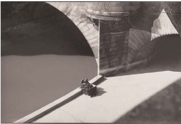
Clochard sur les bords de Seine. 1949. Photographie de Sabine Weiss (née en 1924). Paris, Bibliothèque Marguerite Durand © Sabine Weiss / Bibliothèque Marguerite Durand / Roger-Viollet