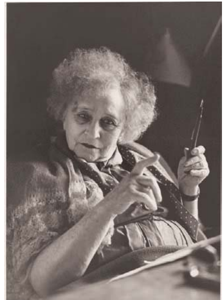
Colette (1873-1954), à son domicile au Palais Royal. Paris, 1953. Bibliothèque Marguerite Durand

altri ritratti di donne celebri: letterate, artiste, attrici, da Sarah Bernhardt a Camille Claudel a Colette, riunite nella sezione intitolata “Célébrités du monde des arts, du spectacle et des lettres”.