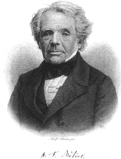
FIGURE 1 – August Ferdinand Möbius (1790–1868)