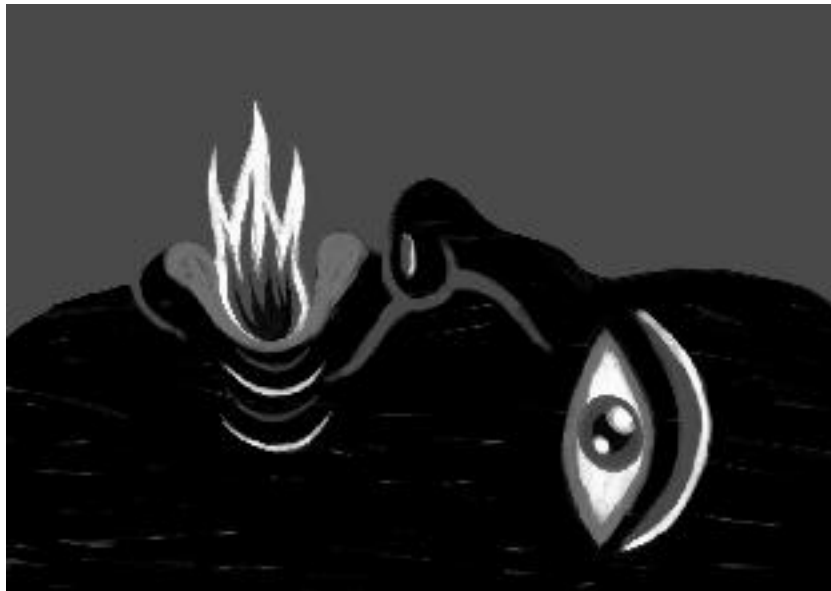
Marco Tóxico. Nuestras voces hablan con fuego . Dibujo digital, 2009.

estimulador de reflexión profunda para nuevas políticas. Solamente quisiera compartir un pequeño suspiro de tristeza en relación a la ausencia del Censo Agropecuario. En el contexto actual de Bolivia, contar con el conocimiento de la estructura familiar, productiva y territorial de los campesinos y agricultores es fundamental; postergar ese diagnóstico no llevará más que a una degradación continua de las condiciones de vida de esos campesinos por la imposibilidad de definir políticas adecuadas. Todo este diálogo se puede aplicar al mismo Censo Agropecuario y podemos esperar que este mensaje sea entendido.