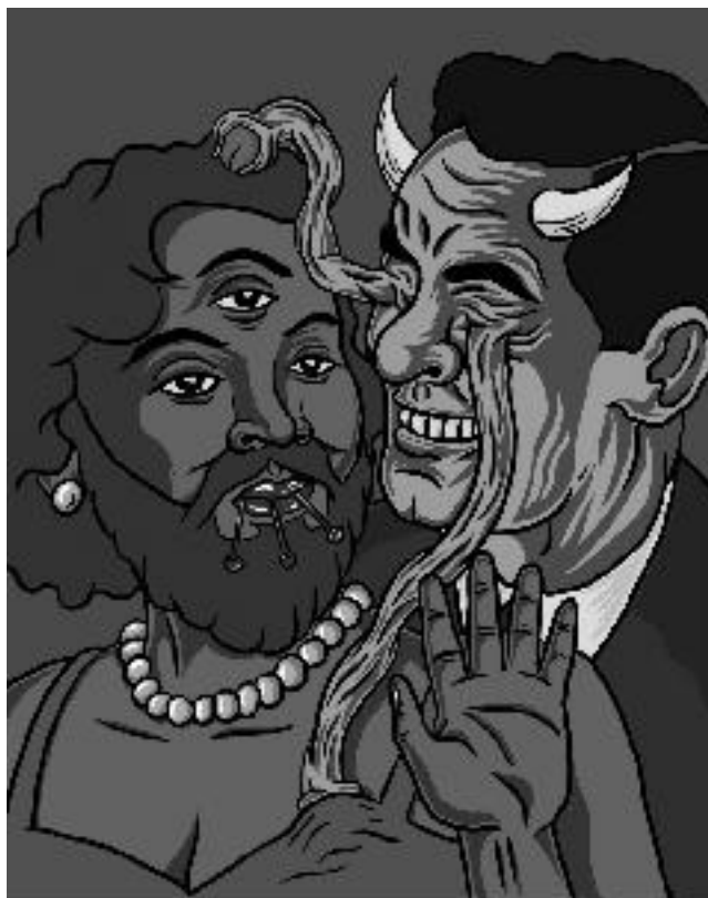
Marco Tóxico. Pachamama zombie . Dibujo digital, 2008.

determinar la distribución de recursos, junto con el peso poblacional; autoridades gubernamentales han anunciado que se propiciará acordar un pacto fiscal 13 .