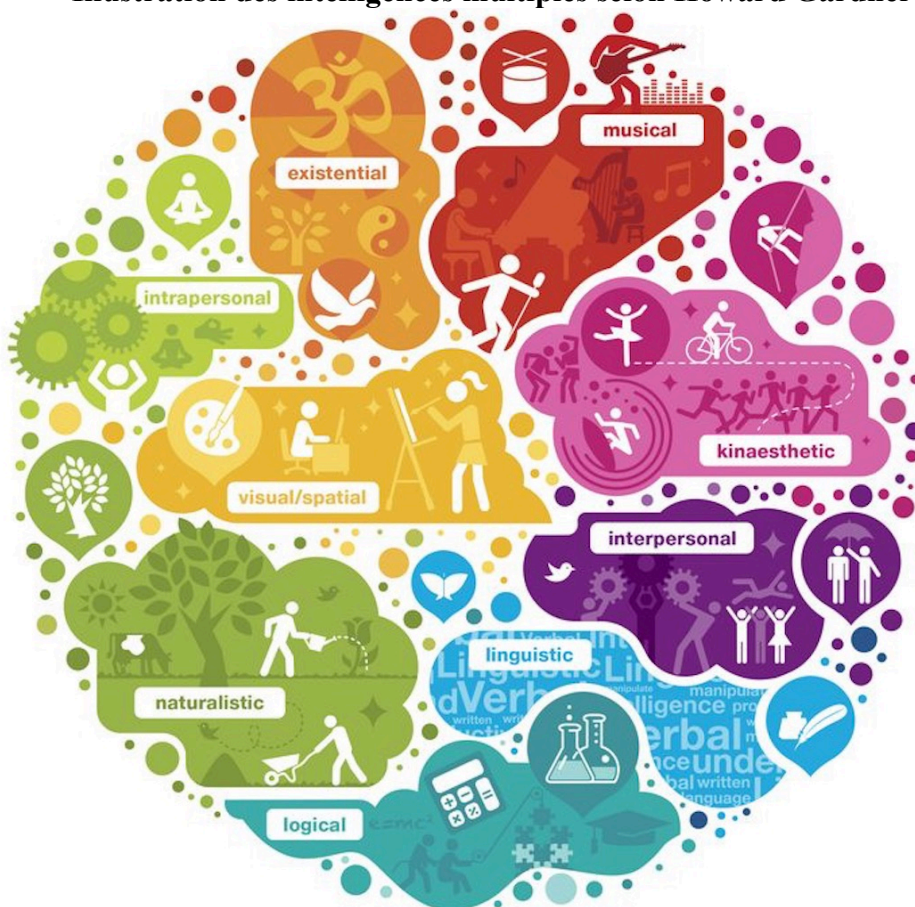
Illustration des intelligences multiples selon Howard Gardner