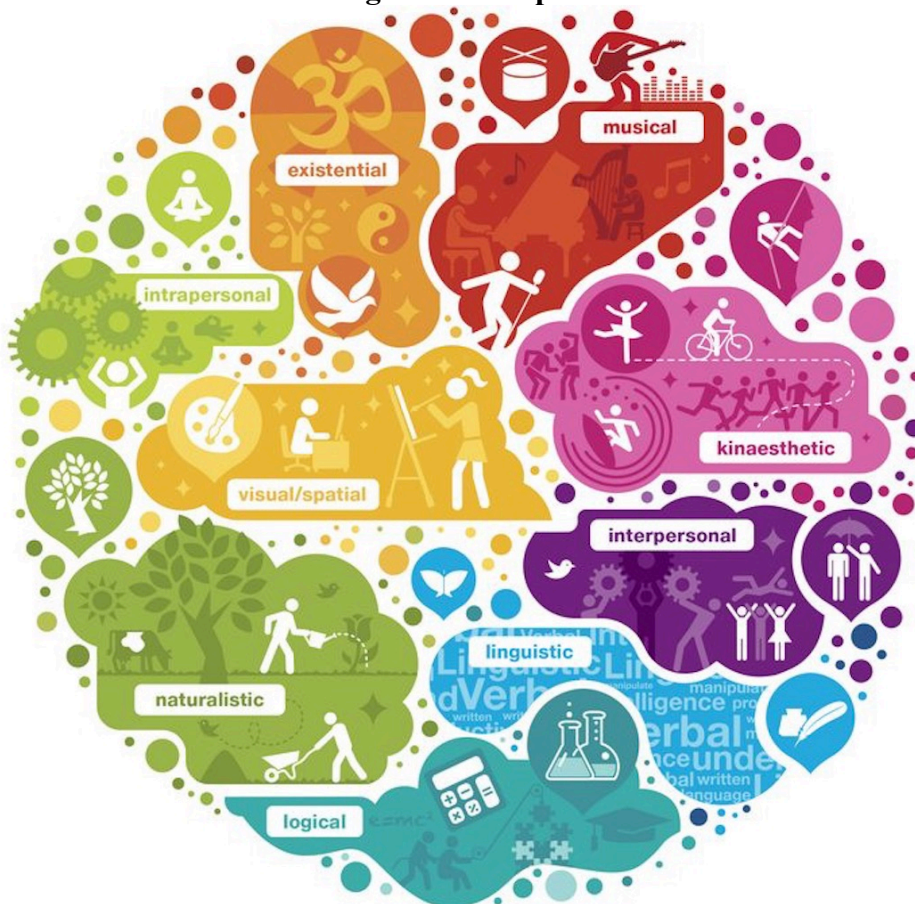
Illustration des intelligences multiples selon Howard Gardner