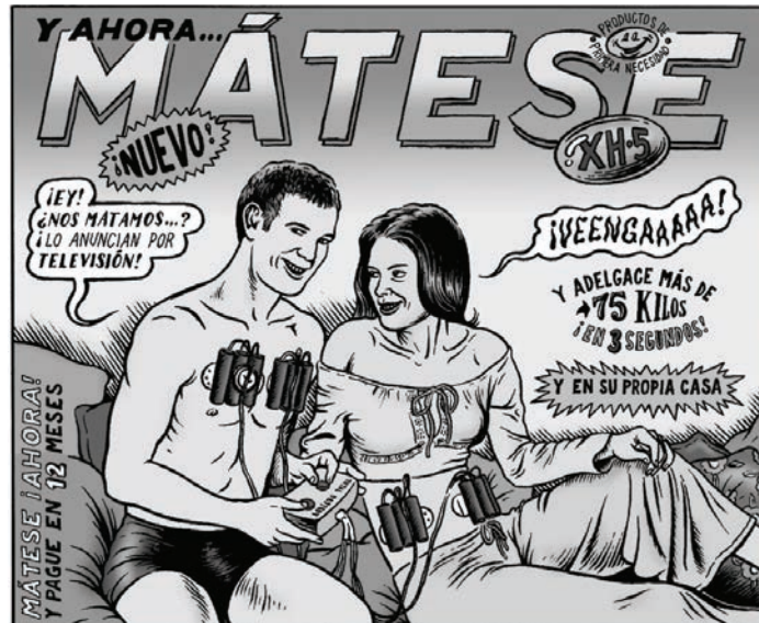
Figure 2 : Miguel BRIEVA, Dinero , Barcelona, Mondadori, 2008, s.p.

Bombes autour de la ceinture, doigt sur le détonateur, ce couple réactualise le thème de l'art de mourir mais ici au service de la lutte contre la cellulite. Les regards des personnages sont glacés et glaçants. Au commencement était la bêtise, semble donc nous dire Miguel Brieva. D'une part, l'infini cynisme de ceux qui sont prêts à tout pour un coup juteux et d'autre part, l'infinie bêtise de ceux qui sont prêts à tout pour y croire.