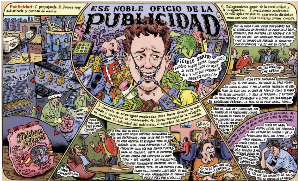
Figure 4 : Miguel BRIEVA, Memorias de la tierra , Barcelona, Reservoir Books, Random House Mondadori, 2012, p. 79.

Certaines planches du livre qui jouent à l'extrême sur la fragmentation et la multiplication de micro-scénettes demandent ainsi à marquer une pause pour une lecture méticuleuse et attentive. Un grand nombre de ces dessins fourmillent de détails comme celui [Figure 4] qui décline différentes acceptions personnelles du mot « publicité ». Sur le plan esthétique, certains analystes ont vu dans cette propension à l' horror vacui , le trait d'un « F. Ibáñez mucho más ácido y con toque retro » 18 .