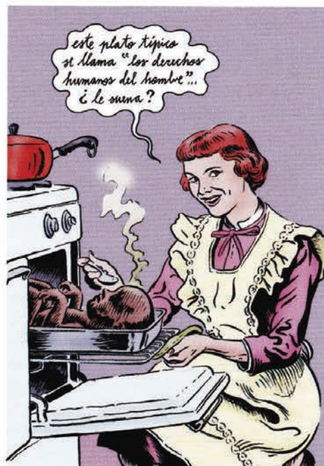
Figure 3 : Miguel BRIEVA, Dinero , Barcelona, Mondadori, 2008, s.p.

Bombes autour de la ceinture, doigt sur le détonateur, ce couple réactualise le thème de l'art de mourir mais ici au service de la lutte contre la cellulite. Les regards des personnages sont glacés et glaçants. Au commencement était la bêtise, semble donc nous dire Miguel Brieva. D'une part, l'infini cynisme de ceux qui sont prêts à tout pour un coup juteux et d'autre part, l'infinie bêtise de ceux qui sont prêts à tout pour y croire.