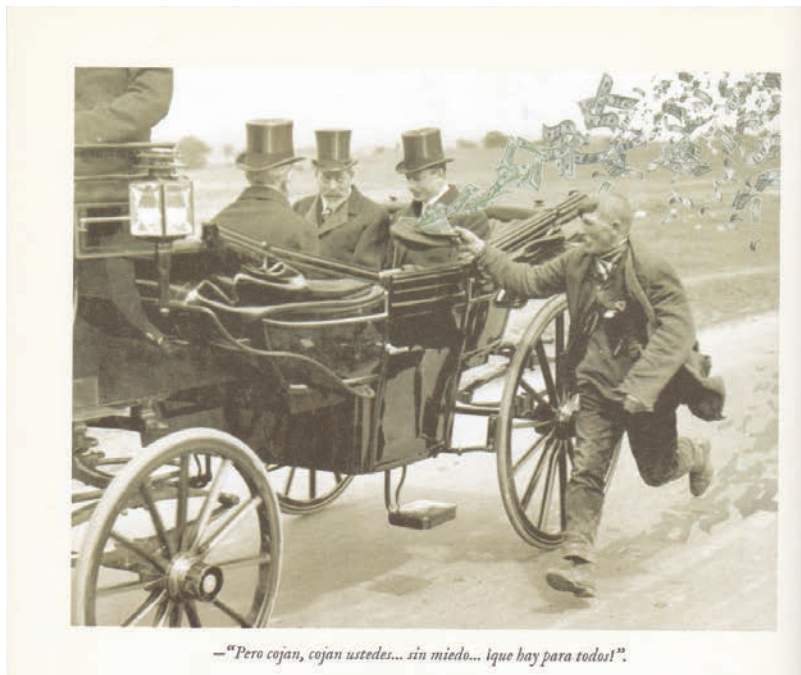
Figure 6 : Marcz DOPLACIÉ (Miguel Brieva), Obras incompletas , Belleza Infinita, 2012, s. p.

Miguel Brieva procède d'abord par détournement simple : une image sur laquelle on ajoute de nouveaux éléments et où la légende associée vient renforcer le détournement. Cela relève parfois du simple jeu. Par exemple [Figure 6], en ajoutant des dollars volant au vent, le mendiant déguenillé devient généreux donateur courant derrière le coche et offrant quelques billets à ces gentlemen en haut-de-forme qui détournent pudiquement le regard comme gênés par tant d'insistance et de bonté.