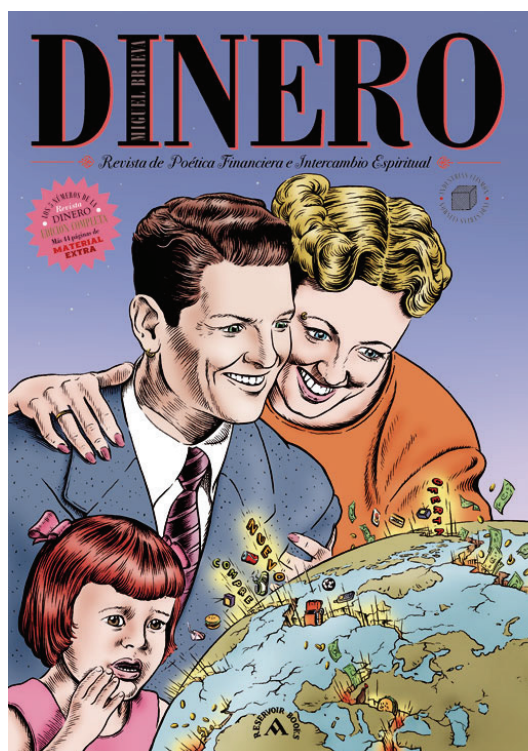
Figure 5 : Miguel BRIEVA, Dinero , Barcelona, Mondadori, 2008, couverture.

La télévision apparaît comme un des principaux vecteurs de l'intoxication publicitaire. Elle n'échappe donc pas au regard critique de Miguel Brieva. Le dessinateur prend d'ailleurs un malin plaisir à l'orthographier avec un « c » : « Televisión », car elle est la mère de tous les vices. Or la télévision, c'est justement ce que l'écrivain Bernard Noël définit comme ce « trop plein qui fait le vide » 26 . Le gavage télévisuel apparaît alors au service du gavage publicitaire qui impose son rythme effréné et « occupe » 27 nos esprits. L'« infraculture » audiovisuelle imposée, le bonheur à portée de télécommande sont ainsi souvent moqués dans les dessins de Miguel Brieva.