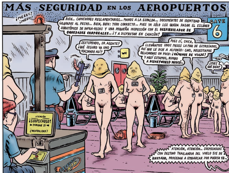
Figure 1 : Miguel BRIEVA, Bienvenido al mundo , Enciclopedia Universal Clismón, Barcelona, Reservoir Books, 2013 [2007], p. 115.

On trouvera par exemple des scènes explicites de nudité, ainsi celle du contrôle de sûreté en aéroport [Figure 1].