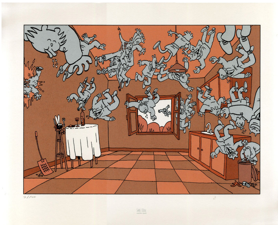
Figure 2. Sérigraphie La Mouche, librairie Sans Titre, 1998.

Selon nous, l'une des premières limitations des Aventures d'une mouche repose non tant sur son animation que sur sa sérialisation. Elle contraind de fait à un format d'histoires courtes et indépendantes qui ne s'inscrivent pas dans une dynamique narrative générale. Ceci posé, un visionnage des 22 épisodes du DVD permet de voir que les histoires se limitent elles-mêmes à mettre en évidence la candeur ironique de la mouche et à livrer, sous le voile animalier, une critique de notre société et des rapports humains. Le procédé zoomorphique n'a évidemment rien de nouveau, bien établi par le genre de la fable ; pensons ainsi à « La cigale et la fourmi » de La Fontaine (1621-1695). Le discours satirique sous-jacent peine pourtant à prendre de l'ampleur, restant sous une approche enfantine qui cadre trop avec le minimalisme du graphisme pour laisser échapper un humour réellement corrosif — comme celui que l'on retrouvait dans l'inversion mise en scène par une rare sérigraphie faite en 1998 par Trondheim pour la librairie bruxelloise Sans Titre 37 (voir Figure 2).