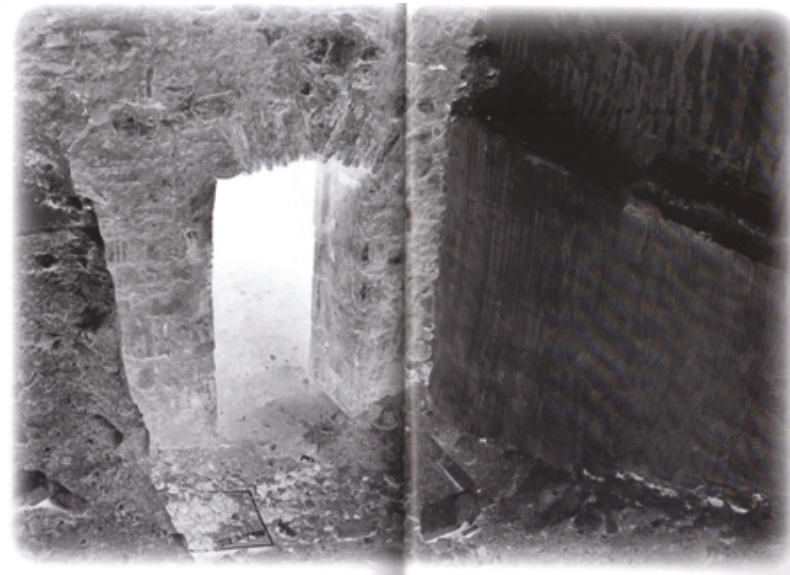
Photographie extraite d' Horizons incertains . © Martine Aballéa.

A l'image de la dernière photographie, ouverte et fermée à la fois, il n'y a pourtant ni porte d'entrée ni issue de secours dans l'ouvrage. L'horizon d'attente reste justement incertain. Les répétitions et les impressions de déjà-vu –rues, ruelles ou avenues, envisagées dans leur perspective fuyante, façades ou devantures anonymes et jamais photographiées frontalement...- produisent un effet intrigant, proche de celui des techniques itératives de la littérature. Tout se déroule enfin comme si nous étions ailleurs, simples passants dans le passage, comme tournant sur nous-même ou à l'intérieur d'une structure labyrinthique à la recherche d'une sortie.