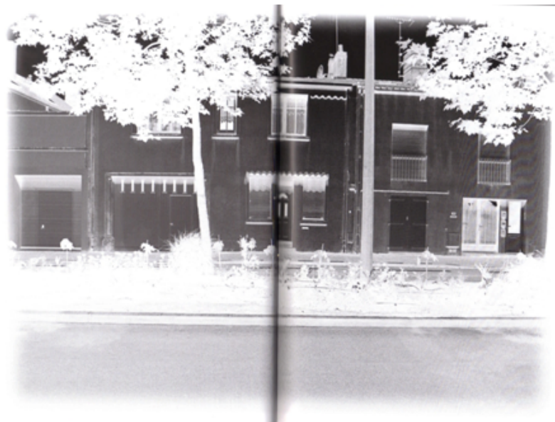
Photographie extraite d' Horizons incertains .

Au premier abord, Horizons incertains paraît pourtant bien ainsi empreint, dans tous les sens du terme, de romanesque. Prises avec un appareil numérique lors de plusieurs déambulations dans la cité sablaise, les photographies laissent autant la part belle à la narration qu'à la "circulation" esthétique. En effet, comme l'explicite malicieusement le sous-titre « Nuit blanche aux Sables », toutes les photographies sélectionnées ont été modifiées par ordinateur pour se présenter comme des négatifs non-inversés. Elles semblent ainsi, dans leur succession apparemment signifiante -un trajet dans une ville désertée et vidée ouverte sur la mer-, une narration peut-être plus complexe qu'il n'y paraît.