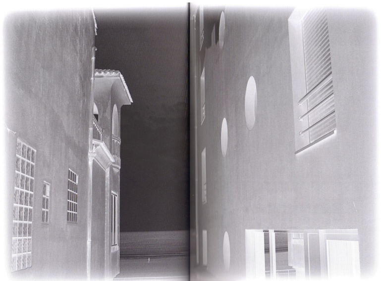
Photographie extraite d' Horizons incertains . © Martine Aballéa.

« Pour accrocher et ne pas être invraisemblables, elles doivent comporter des éléments reconnaissables, vraisemblables. Éléments qui sont des sortes d'appâts pour mener à autre chose et qui font que tout à coup s'opère un recul, la petite sensation de décalage que je souhaite. J'essaie de choisir des images qui [...] donnent une ambiance ou peuvent être considérées comme un décor. [...] J'aime ce côté flou d'une image que l'on reconnaît immédiatement mais qu'on ne peut localiser. » 11