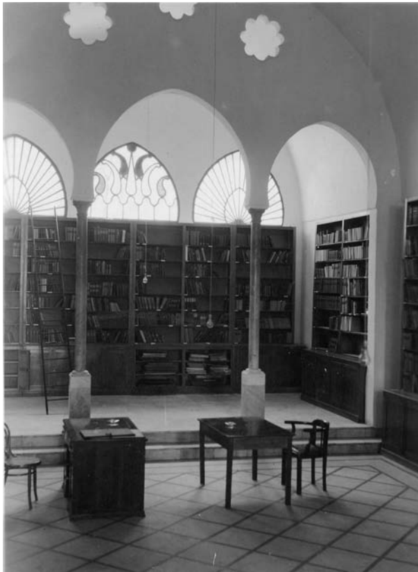
Fig. 15 : La bibliothèque, vers 1949.