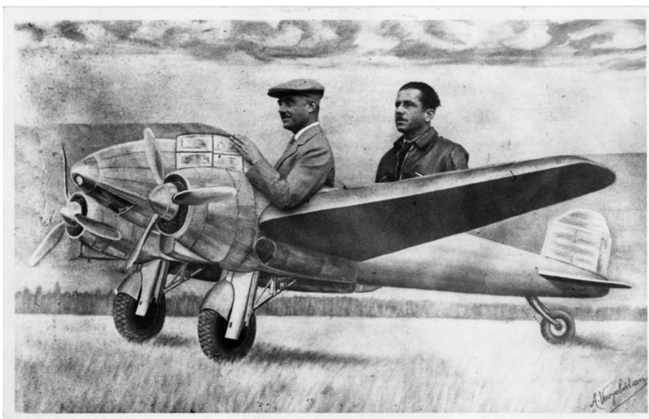
Fig. 3 : H. Seyrig (à gauche) et Aziz, son chauffeur. Vers 1950 ?