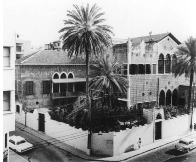
Fig. 14 : Vue de la maison Beyhoum à l'angle de la rue de l'Alliance et de la rue Georges Picot.