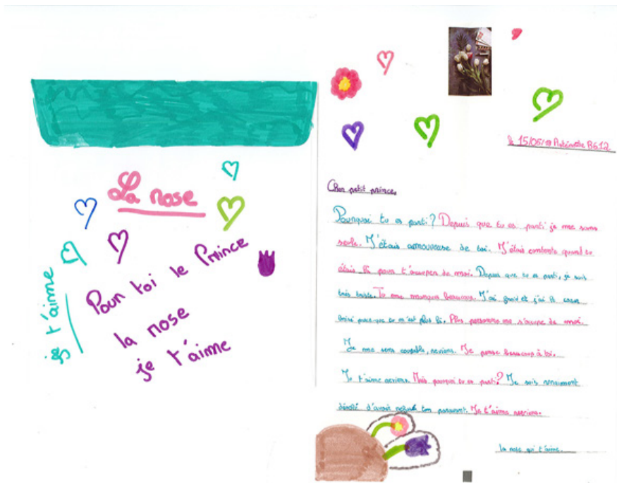
Annexe 2 : lettre de Manon (5e année)