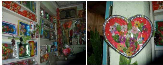
9 et 10. Modèles de cadres floraux, Rissani

Le choix des motifs des décors floraux dans le village de sédentarisation de Merzouga, s'explique aussi face à des choix de modèles du « beau » qui sont désormais, et de plus en plus, empruntés à l'univers des séries mexicaines 19 que les femmes regardent à la télévision. Ces films mettent en scène des histoires d'amour entre des individus riches et puissants vivant dans de grandes villas luxueuses. Un luxe suranné où l'opulent mobilier (canapé de cuir, bois précieux) propose aussi à profusion des fleurs en pots et des fleurs coupées qui trônent dans toutes les pièces sur les tables et les guéridons. Ainsi, une sorte de modèle esthétique