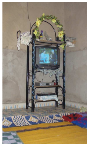
7. Salon, Taqucht

L'observation de l'ensemble des décors intérieurs souligne l'apparition du superflu dans une société où la culture matérielle se limite à des objets nécessaires ayant tous une fonction utilitaire bien précise (Benfoughal, 1996 : 61). Mais ce superflu est commun à tous, point de diversité dans le choix des agencements, ni surtout de distinction dans les objets parés.