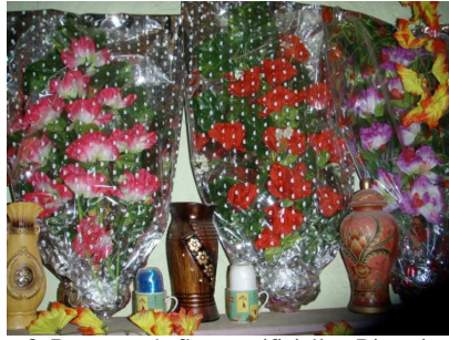
8. Bouquets de fleurs artificielles, Rissani