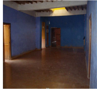
5. Couloir de la même habitation menant aux espaces privés

L'absence de décoration des habitations trouve une justification dans le discours des intéressés, elle y est dédaignée car servant, dit-on, à « se mettre en valeur », ce qui, du point de vue des Aït Khebbach, est vivement déprécié. Les valeurs de l'honneur qui structurent une manière d'être spécifique et valorisée font des perceptions idéelles de l'individu, un être calme qui domine ses accès d'humeur, mesure sa parole et ne perd jamais le contrôle de lui-même. Aussi, il ne doit pas s'encombrer de choses superflues, de fioritures inutiles... La richesse financière ou la puissance n'ont rien à voir avec l'honneur. L'homme d'honneur évite d'entreprendre ce qui sort de l'ordinaire 13 . Ces remarques s'appliquent aussi au nombre restreint d'objets dans les habitations, les pratiques de consommations récentes n'ont pas notablement modifié la faible quantité d'objets. C'est ici la standardisation de nouveaux artefacts qui mérite d'être interrogée.