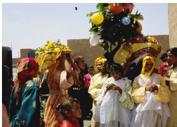
11. Cortège de jeunes filles attendant les mariés

Ces jeunes filles célibataires portent sur la tête un plateau à thé 22 rempli d'objets en lien avec la séduction et la fertilité : des fleurs en plastique, du parfum et de l'encens à brûler. Auparavant, on utilisait des branches de laurier rose ( alilli ) ou blanc, signe de fécondité. Les fleurs artificielles se substituent désormais au laurier. Un feuillage de plastique dans lequel on ajoute des ballons gonflables de caoutchouc aux couleurs vives qui figurent des fleurs ou des fruits sont là aussi pour symboliser la fécondité 23 . Il y a une dizaine d'années, j'ai pu observer l'utilisation de palmes pour décorer la demeure du marié, les fleurs du palmier dattier ne sont, elles, jamais utilisées. En effet, si les fleurs sahariennes manquent de couleurs, la polychromie du plastique s'y substitue parfaitement. De plus, comme précédemment énoncé, les dattes sont bien trop précieuses pour être sacrifiées.