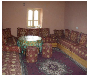
4. Salon, village de Hassylbyed