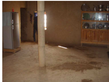
1. Salon en terre battue, Taqucht

des villages de Merzouga et d'Hassylbyed 11 . Ce qui est notable, c'est que l'architecture y est similaire (pisé, toiture en roseau et usage de la chaux), seul le mobilier atteste des distinctions financières 12 , il n'y a pas de décoration intérieure.