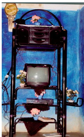
6. Salon, Merzouga

la région de Merzouga, on ne signale pas de vannerie en plastique à usage strictement décoratif. Les vanneries sont utilisées dans le quotidien (cuisson du pain et du couscous) mais ne sont pas fabriquées par les Aït Khebbach pour qui l'activité est dépréciée et réservée à l'usage des populations harratins, considérées comme subalternes.