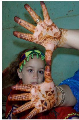
12. Motifs rectangulaires et floraux de henné.

C'est par la construction de nouveaux objets d'étude, une approche des sociétés par l'objet d'apparence anodin, que l'anthropologie de ces espaces ruraux délaissés apportera des clés de compréhension aux changements auxquels ces sociétés sont confrontées.