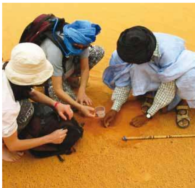
Échantillons de sable

Si les techniques sont connues, les moyens de les mettre en œuvre font souvent défaut dans des régions où les priorités sont ailleurs et où l'on assiste, impuissants, à ce phénomène, à défaut de pouvoir « gérer » le problème sur le plus long terme. Terrains de culture