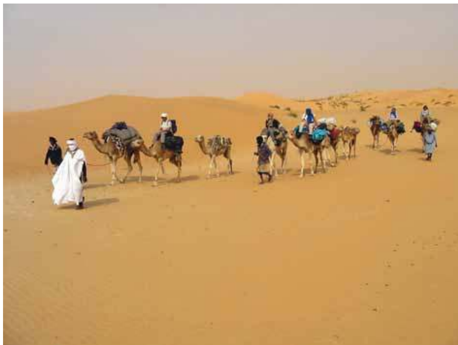
Caravane de trekkeurs, Adrar

L'étalon de l'aridité des zones désertiques est celui des seules précipitations, ce qui mériterait une réflexion sur la notion même de désert où le sable et la géomorphologie des lieux seraient sans réelles incidences. En effet les « sols dunaires comptent 80 à 90 % de sables, mais il suffit qu'un sol comprenne 55 % de sables pour que l'on parle de texture sableuse » (Morel 2008 : 56). On sait aussi l'importance des sables cimentés ( ripple-marks ) qu'étudient les géomorphologues pour comprendre l'histoire des déserts.