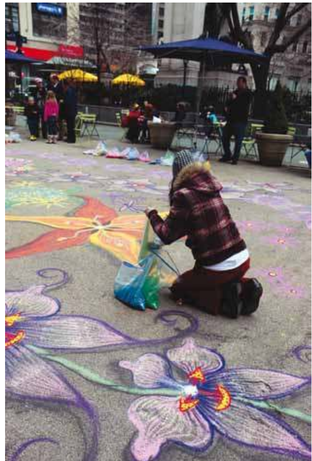
Sand painting, Herald Square, New-York, 2014

ensevelis, axes routiers traversés par des dunes, fondations de maisons emportées par le mouvement du sable, fleuves ou lacs asséchés, les infrastructures les plus coûteuses ou les plus sophistiquées ne semblent pas peser très lourd face à cette matière, comme l'illustre le documentaire photographique ( Curiosa ) cosigné par le géographe Roman Stadnicki et le photographe Manuel Benchetrit, consacré aux paysages urbains dans quelques grandes villes du sud de la Péninsule arabique. Dans ces espaces hypermodernes, climatisés et aseptisés, où le sable est indésirable et l'objet d'efforts de dissimulation notoires, il apparaît pourtant comme l'unique habitant d'infrastructures mégalomaniaques désertées. Trop fin pour atteindre la qualité recherchée dans le béton de construction, trop rond pour réaliser de jolies plages ou des îles artificielles dans la mer (Dubai), le sable du désert doit souvent être remplacé par du sable drainé depuis les fonds marins, voire importé d'une autre région, ce qui donne lieu à un commerce international florissant ! Dans les villes modernes du désert (Pliez 2011), dont la croissance démographique semble, à première vue, permise par des conditions de vie facilitées et par un isolement moindre que par le passé, le sable met sans cesse à mal cette idéologie du progrès et de la modernisation des cadres de vie, n'empêchant pas pour autant celle-ci de continuer de prospérer et de faire rêver.