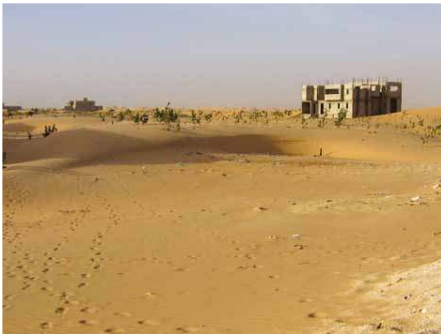
Villa en construction en périphérie de Nouakchott