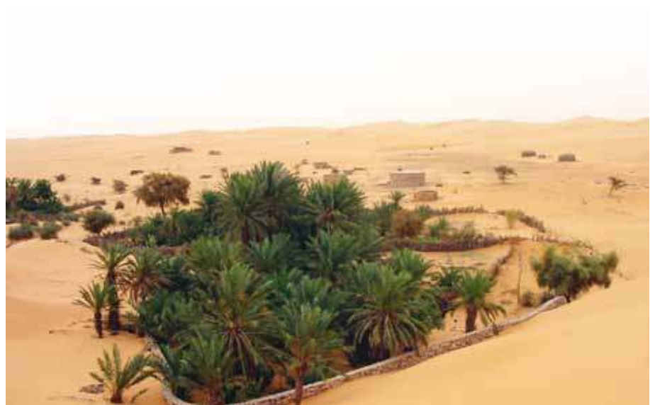
Palmeraie encadrée par le sable

Si l'appel à contribution initial intitulé « Déserts, sable et techniques » n'a suscité qu'un nombre modeste de réponses et illustre la difficulté pour les sciences humaines et sociales de lier « matière, perceptions et vécus », la question méthodologique s'est avérée d'autant plus stimulante qu'elle a ouvert des pistes de réflexion, des champs d'étude et des questionnements nouveaux. C'est l'interface et la complémentarité d'une analyse matérielle (objet sable) et symbolique (les représentations endogènes du sable) qui constituent l'originalité de cette rencontre d'articles. Ainsi, l'étude du sable dans les sand-paintings (évoqué en Australie par Sylvie Poirier) initie la réflexion sur le sable comme support, signe et symbole. Les peintures acryliques ont remplacé le sable et si ce passage a bien été analysé (l'ouverture vers les marchés de l'art des peintures aborigènes), l'importance et l'usage initial du sable, de la terre ou d'autres matériaux granulaires n'a pas retenu l'attention.