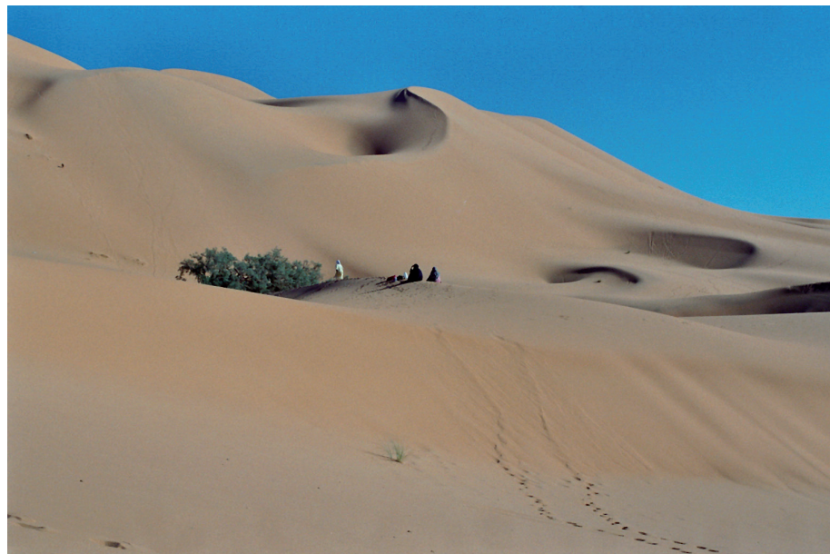
Bosquet de tamaris, lieu des vœux adressés à Lala Merzouga

La cuisson du pain dans le sable est réalisée pour des raisons prophylactiques et/ou religieuses. Lala Merzouga protège le village et lui dispense ses vertus. Accompagnées d'enfants, les femmes s'y rendent pour faire exaucer des vœux divers, demander une protection, une guérison, ou le retour d'un proche. Elles partent en groupe, le plus souvent en début d'après-midi. Pour rejoindre Lala Merzouga, il faut une bonne heure de marche dans le sable. Leur station se situe au pied de la dune, près d'un bosquet de tamaris.