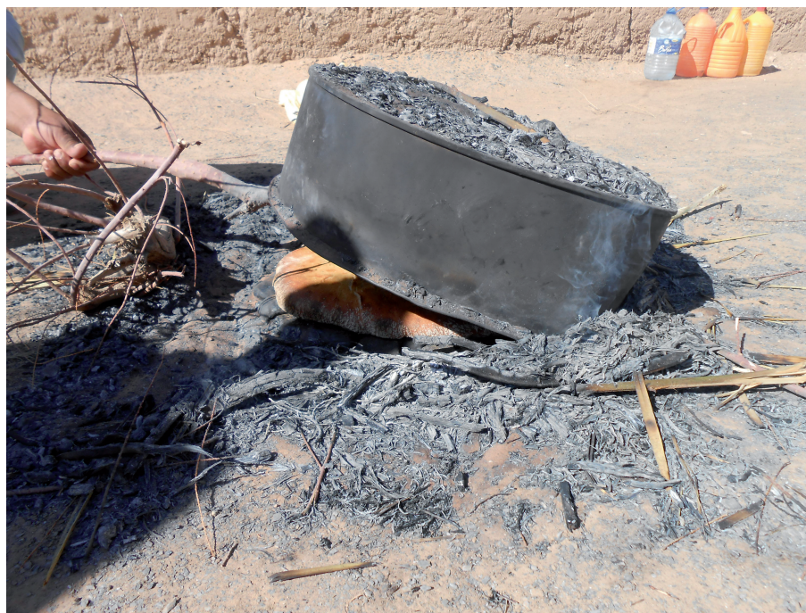
Sortie du pain

l'utilisation de l'environnement pour survivre. Ce sont principalement les chameliers qui les accompagnent et leur proposent de goûter ce pain. Il s'agit là aussi de « pain de l'intérieur 37 » agrémenté de viande, d'oignons et d'épices. Cette technique fait désormais partie de tous les bivouacs proposés aux touristes, attirant l'admiration des voyageurs devant l'ingéniosité des nomades. La figure du nomade exerce une véritable fascination sur les touristes qui découvrent le désert, c'est aussi un moyen pour les Aït Khebbach de mettre en avant leur culture et leur ancien mode de vie.