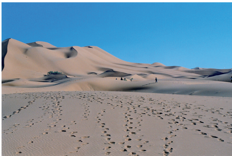
« Lala Merzouga », haute formation dunaire près du village de Merzouga, 2005

L'apparition du phénomène au Maroc a lieu simultanément dans le Tafilalt et plus à l'ouest dans la région saharienne de M'hammid au sud de Zagora (cf. carte). Ces deux endroits disposent en effet de formations dunaires de taille significative. Plusieurs interprétations sont données quant à l'origine de ces cures singulières. La première est fournie par les habitants de Merzouga qui auraient inventé la pratique pour attirer des touristes. Les habitants de M'hammid les auraient imités. Dans la région de M'hammid c'est la version inverse qui m'a été donnée. Ces deux espaces sahariens se livrent à une concurrence acharnée pour attirer les visiteurs. À M'hammid, on appâte les touristes en montrant la photographie de la grande dune de Merzouga (Lala Merzouga) pour faire croire que les dunes y sont toutes aussi grandes, alors qu'en réalité l'erg Chegaga (près de M'hammid) est bien moins étendu et ses dunes moins hautes que celles de l'erg Chebbi qui domine Merzouga. Ainsi se joue une quasi-guerre de l'image des sables.