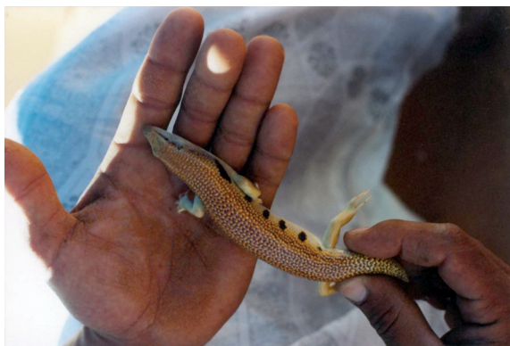
Scincus scincus (Linnaeus, 1758)

La comparaison animale choisie n'est pas flatteuse, elle est utilisée avec ironie voire raillerie par les Merzougui. L'immersion dans le sable et le dégagement du curiste rappelle la sortie du lézard des sables 24 . L'appellation est aujourd'hui connue de la plupart des curistes interrogés aussi on utilise plus volontiers le mot chghchman qui est le terme amazigh pour désigner le Scincus scincus sans être la traduction littérale de l'euphémisme « poisson de sable » 25 (Champault 2003). Toujours sur le mode de la moquerie 26 , l'expression amazigh ait ouzgal « ceux qui s'enterrent » est aussi utilisée soulignant l'ironie d'une pratique comparée à un « auto-enterrement ».