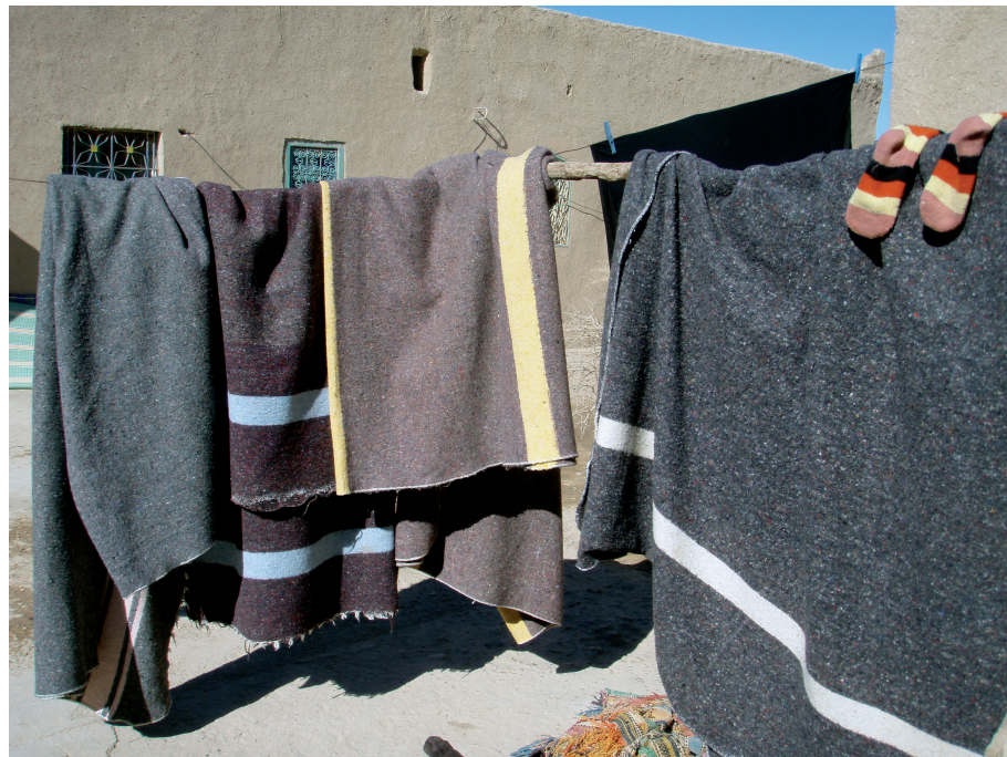
Modèles des couvertures dites « des prisonniers » dans lesquelles les curistes s'enveloppent après le « bain de sable » Merzouga, 2008.