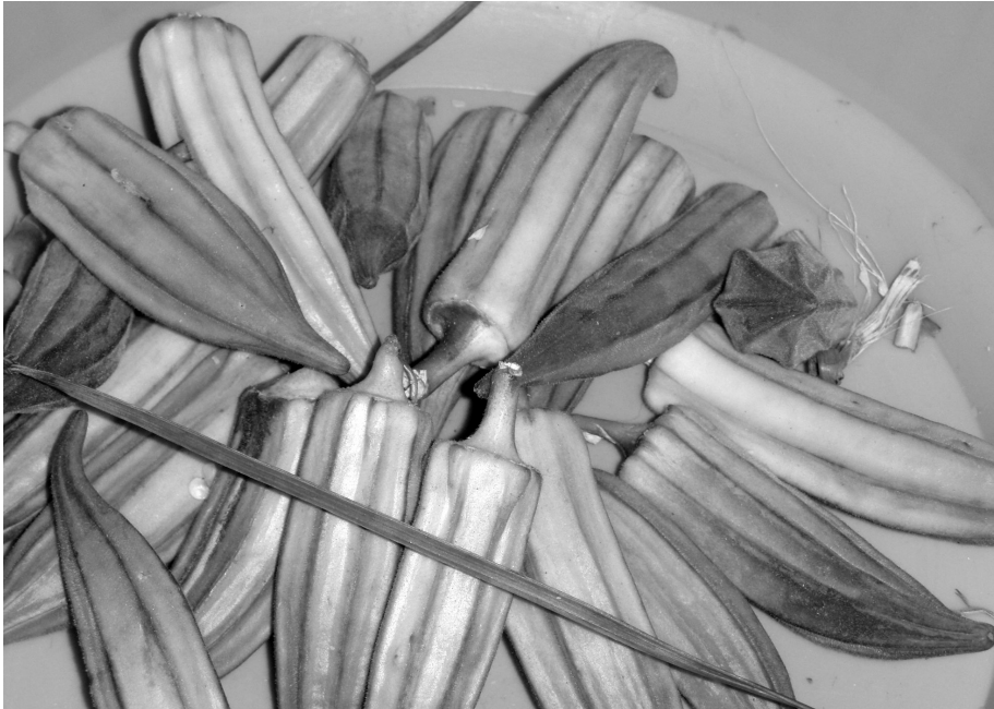
Fig. 3 : Légumes « mulghiya » dont les qualités gustatives sont appréciées séchées puis réhydratées, Merzouga, 2010.

Il convient d'associer, aux vertus de la dessiccation, celles conjuguées de la chaleur et du sable. En effet, la cuisson des aliments dans le sable est une technique répandue et toujours en usage. C'est le cas lors des visites à Lala Merzouga, dune de sable la plus haute de l'erg Chebbi, personnifiée et sanctifiée, qui protège le village et dispense ses vertus curatives. Accompagnées d'enfants, les femmes s'y rendent pour voir exaucer des vœux divers, demander une protection, une guérison, ou le retour d'un proche. Elles partent toujours en groupe, le plus souvent en début d'après-midi. Pour rejoindre Lala Merzouga, il faut une bonne heure de marche dans le sable. Leur station se situe au pied de la dune, près d'un bosquet de tamaris. Sans qu'il soit ici question de dendrolâtrie, le lieu, à mi-hauteur de la grande dune, permet d'adresser des vœux à Lala Merzouga.