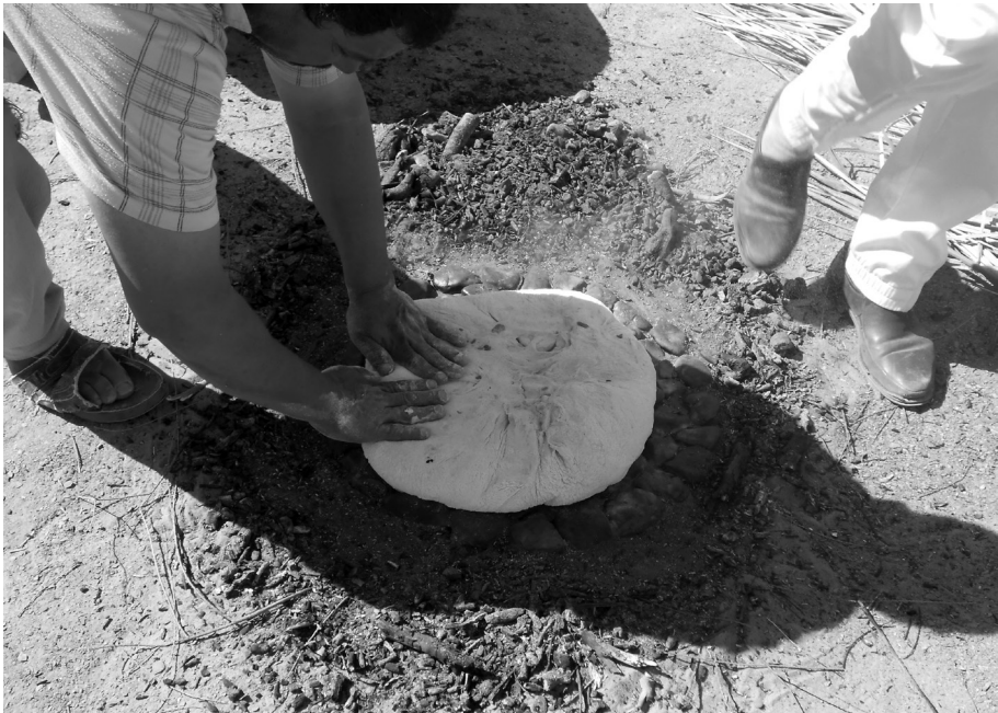
Fig 4 : Pain cuit dans le sable, Taqucht, 2012.

braises et recouvert totalement de sable. C'est une des manières d'entrer directement en relation avec le sacré 14 , en se nourrissant d'un mets ayant été en contact étroit avec le lieu. Ainsi, la nourriture est désormais chargée de la baraka de Lala Merzouga, par le contact et le toucher avec le sable. Une fois retiré du foyer, on débarrasse le pain des grains de sable en le frottant vigoureusement avec des feuilles de tamaris, ce qui lui donne une odeur et un goût bien spécifiques. Le pain est alors consommé par l'ensemble des femmes et des enfants présents.