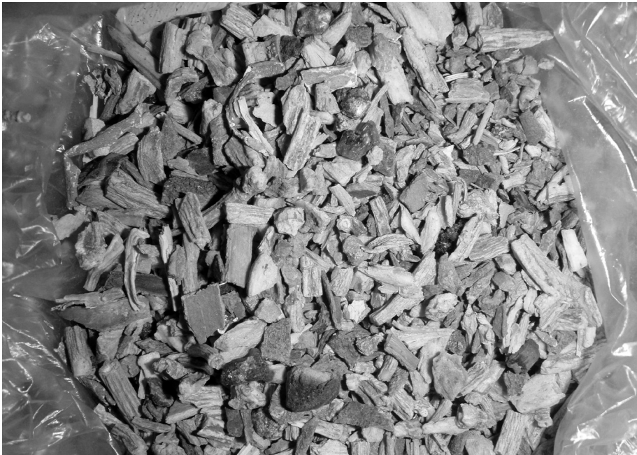
Fig. 5 : Parfum à brûler, Merzouga, 2013.

L'univers olfactif et sensoriel est lui aussi soumis à la valorisation du sec. Le parfum destiné à l'esthétique corporelle est choisi dans un registre où la caractéristique de senteurs associées se réfère à l'absence complète d'humidité. Les fragrances féminines les plus appréciées, celles qui représentent l'univers féminin, sont celles dont les supports appartiennent au domaine du sec (écorces odoriférantes, poudres, résines, etc.). Si l'usage des parfums est, comme ailleurs, genré 18 , ce qu'il convient de retenir, c'est l'importance des composantes en lien direct et exclusif avec la dessiccation.