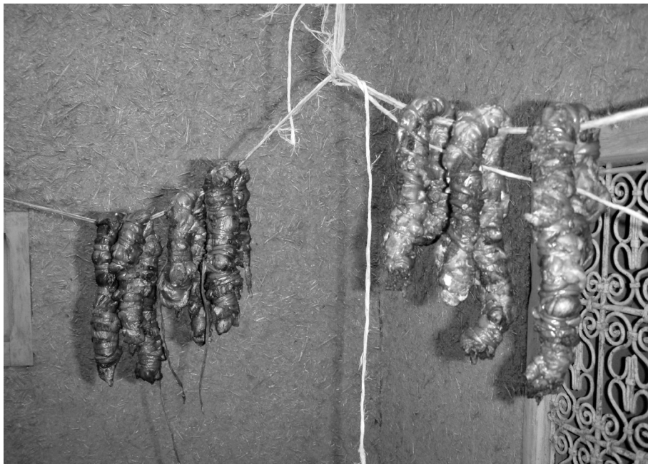
Fig. 2 : Viande mise à sécher, Merzouga, 2011.

Le sel, outre ses vertus dessiccatives, permet d’instaurer une séparation stricte entre nourriture humaine et nourriture démoniaque. En effet, les mauvais esprits ( jnûn ) détestent toutes les saveurs et particulièrement le sel. De plus, le sel « ligote/ attache » ( tissent ar tesmoutoul ) : il exprime le lien conditionnel créé par la commensalité. Aussi les viandes séchées salées sont-elles valorisées.