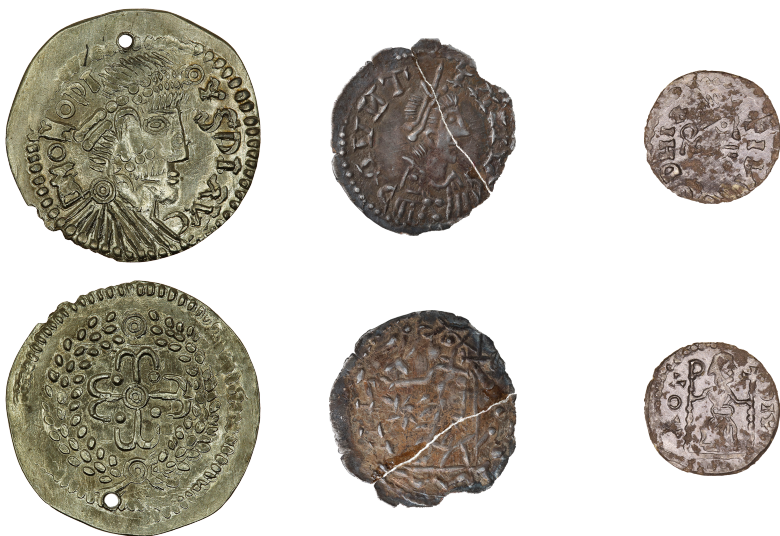
a - Arcy-Sainte-Restitue 24