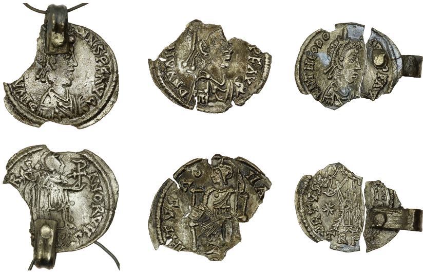
Figure 1 - Argentei « impériaux » découverts à Arcy-Sainte-Restitue 21 (× 2).