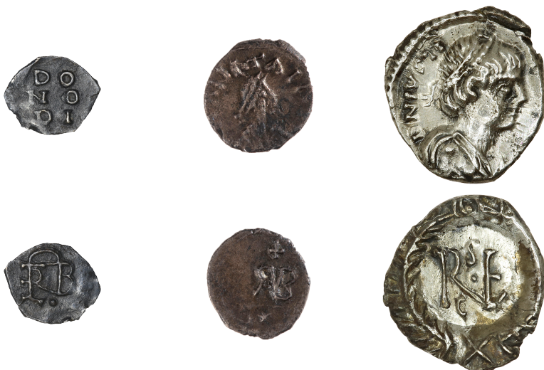
a - Lyon, n° 69.123.3.4