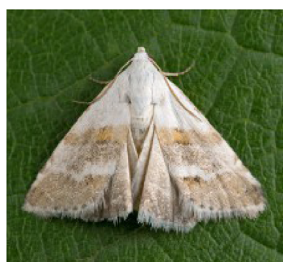
Eublemma minutata Scarce marbled