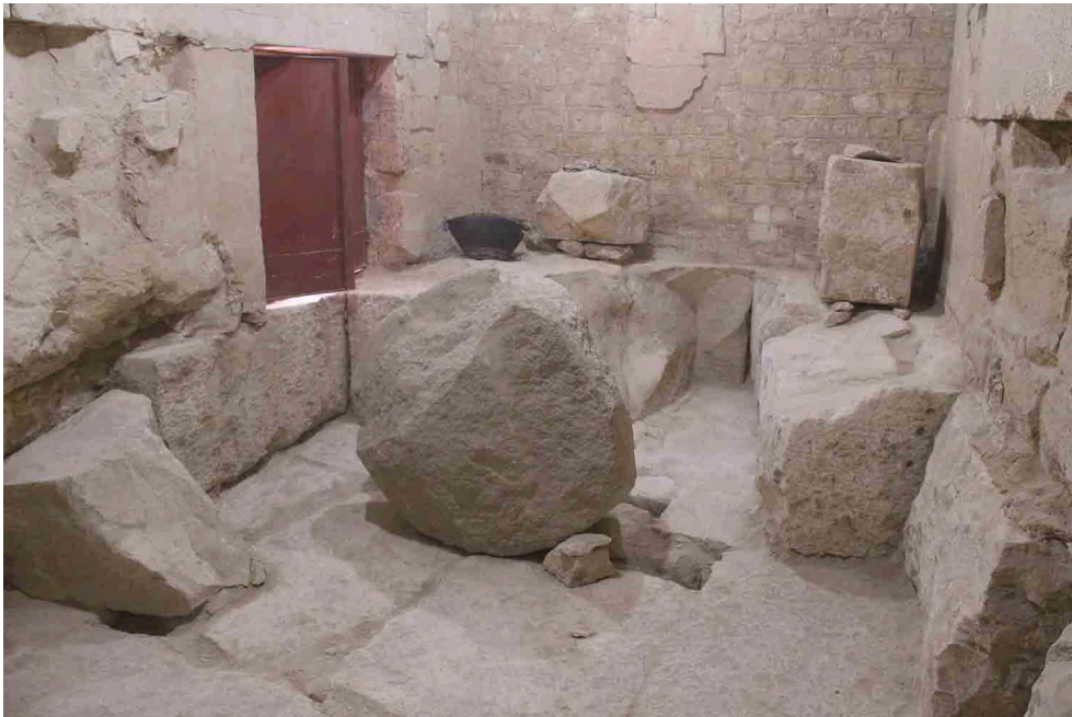
Fig. 6. Sous-dallage de l'appartement funéraire du roi Ibi.