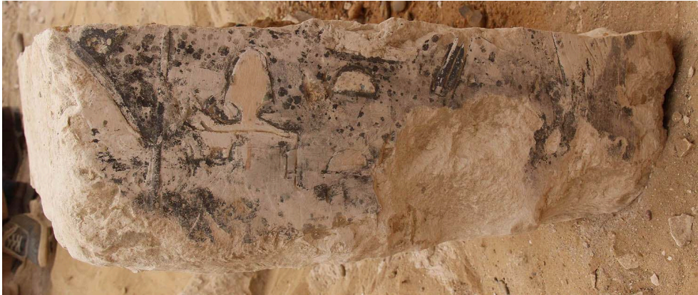
Fig. 3. Bloc de la reine Nedjefet remployé dans le sous-dallage du complexe funéraire de la reine Inenek.

découverte inattendue nous permet désormais de dater (relativement) cette reine mystérieuse avec plus de précision (fig. 3).