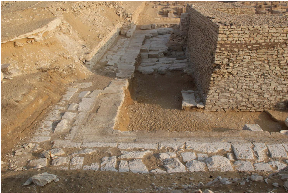
Fig. 1. Angle sud-ouest du complexe funéraire de la reine Ankhnespépy II.