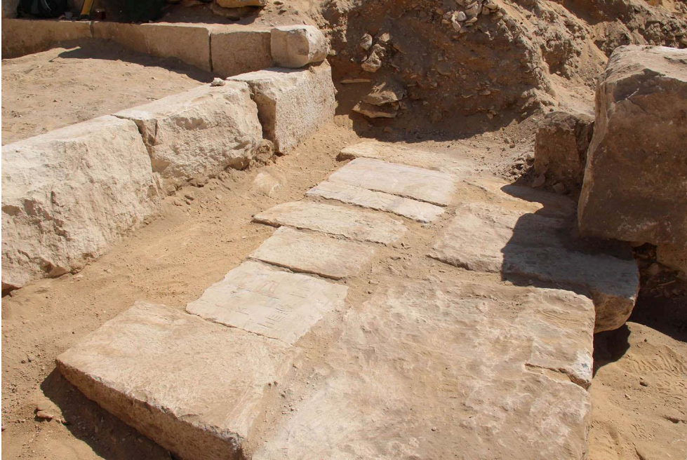
Fig. 4. Blocs de remplissage décorés utilisés dans le dallage du complexe funéraire de la reine Noubounet.

outre, nous avons découvert des céramiques conservées en place dans l'une des pièces du bâtiment (fig. 5).