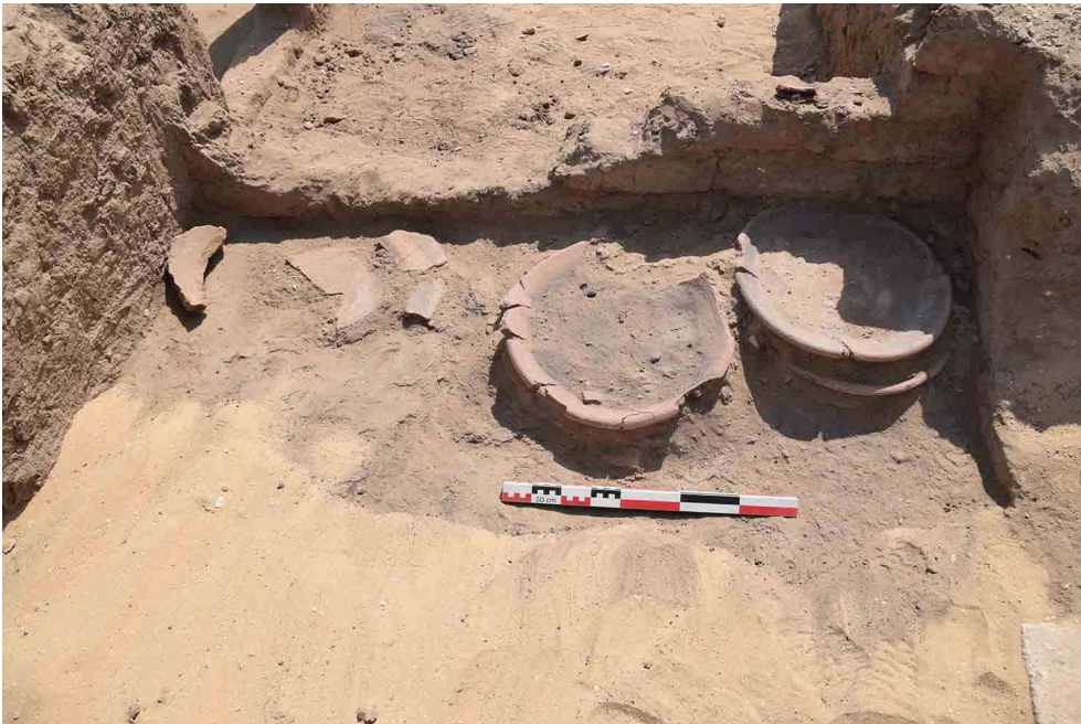
Fig. 5. Céramiques conservées en place dans une pièce du complexe funéraire de la reine Noubounet.