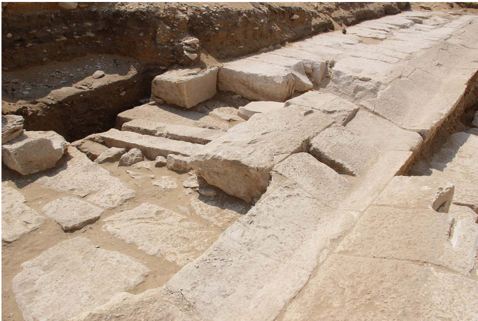
Fig. 2. Canalisation du péribole sud du complexe funéraire de la reine Ankhnespépy II.