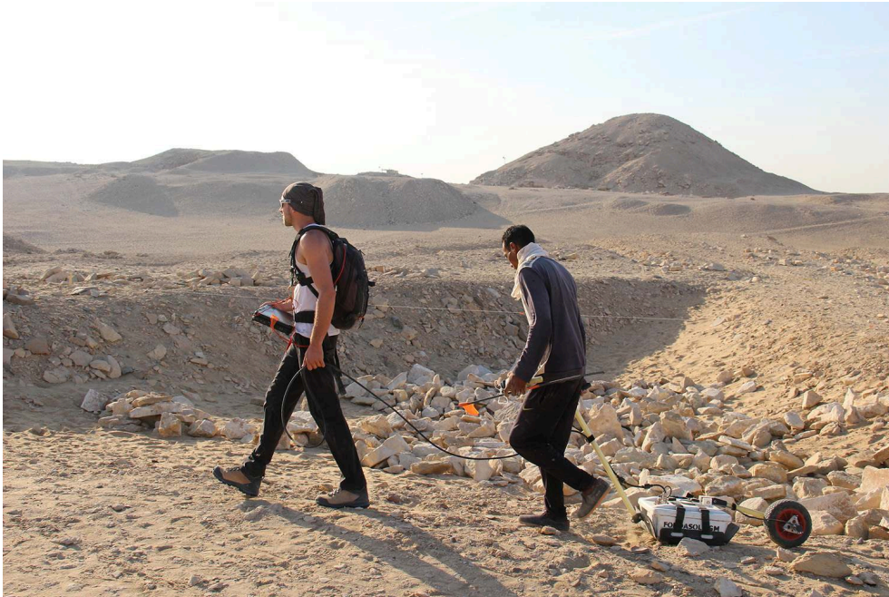
Fig. 7. Survey géophysique de la nécropole.