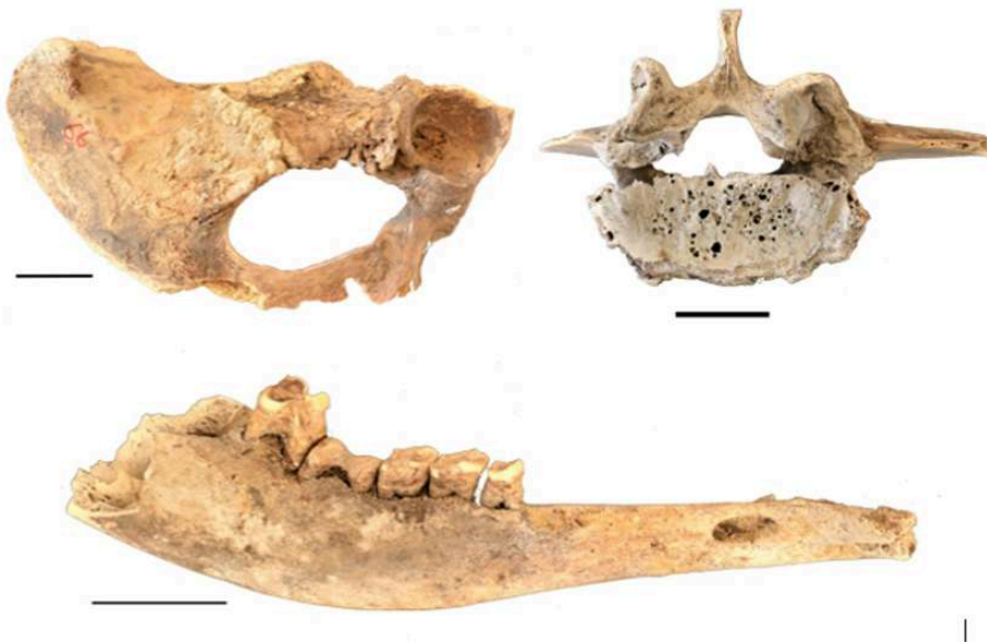
Fig. 9. Pathologies présentes sur les os de bovidés.