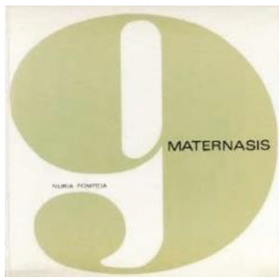
Maternasis , 1967. Portada

Editado simultáneamente en Francia por la editorial Pierre Tisné con el título 9 y en España por Kairós, 10 Maternasis , 11 que indudablemente se nutre de la experiencia de maternidad de su autora, relata los nueve meses de embarazo de la protagonista. 12