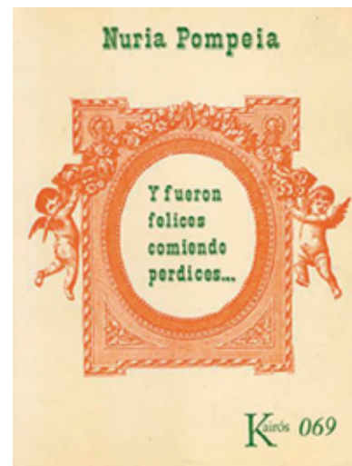
Y fueron felices comiendo perdices , 1970. Portada.