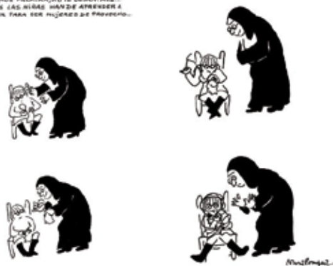
POMPEIA, NÚRIA y VÁZQUEZ MONTALBÁN, Manuel (1972). La educación de Palmira . Editorial Andorra. Portada.