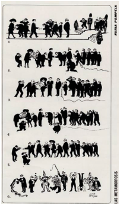
«Las Metamorfosis», Triunfo (321), 27 de julio de 1968, p. 67.