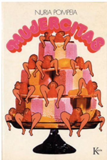
POMPEIA, Nuria. Portada Mujercitas , 1975.