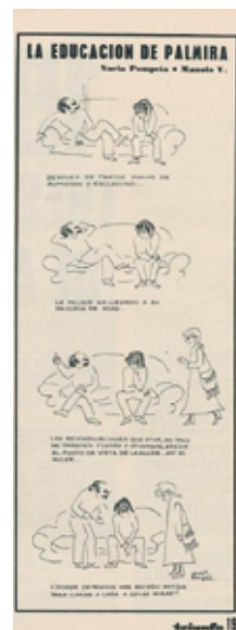
POMPEIA, NÚRIA, «La educación de Palmira», Triunfo , (463), 17 de abril de 1971, 19.

Como lo explica Manuel Vázquez Montalbán en «Las ruinas de Palmira», un texto publicado en Triunfo para acompañar la última aventura del personaje, que será retomado posteriormente como epílogo del álbum, Palmira iba a ser, en principio, Palmiro, «un extraño muchacho, tímido y sometido a la constante educación imperialista de los hombres y las cosas ( idem )».