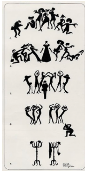
«Las Metamorfosis», Triunfo (309), 4 de mayo de 1968, p. 83.

uno de los semanarios más insignes de la época en el que escriben un sinnúmero de periodistas e intelectuales, entre los cuales hay muchas futuras figuras centrales del movimiento feminista de la Transición. En efecto, el semanario antifranquista sirve en estos años de tribuna de debate sobre la situación de las mujeres, abordando alguno de los temas más candentes que luego retomará el movimiento feminista tras la muerte de Franco. 27