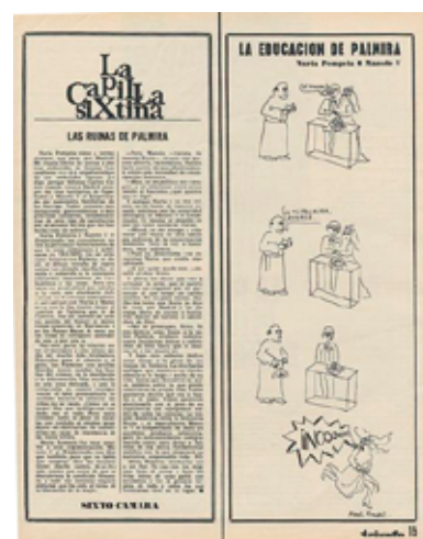
POMPEIA, NÚRIA, «La educación de Palmira», Triunfo , (512), 22 de julio de 1972, 15.