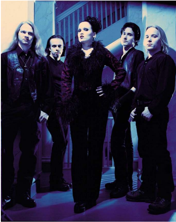
Photographie promotionnelle de Nightwish (2000)