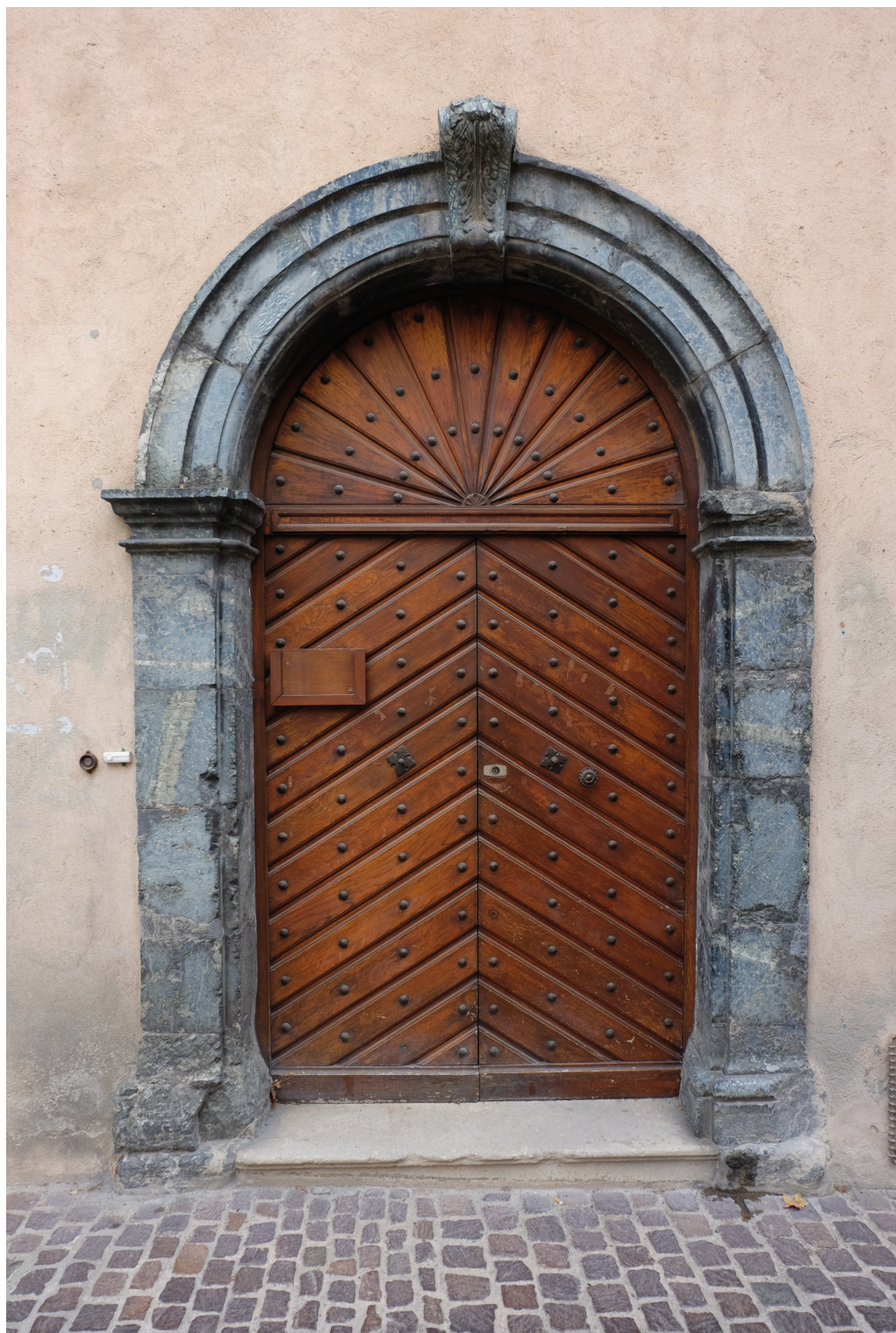
Entrée ouest du château de Cogolin, demeure de Joseph-Madelon de Cuers.