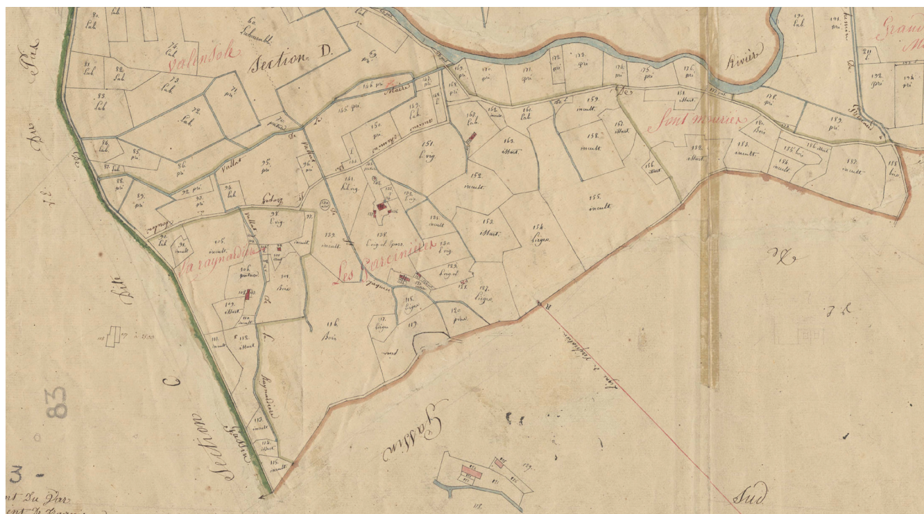
Le quartier des Garcinières dans la commune de Cogolin en 1813 114 .

seigneurie de Cogolin que dans la microseigneurie des Garcinières 115 . Cette dernière est alors située dans le consulat de Cogolin : « Y ayant dans le territoire de Cogolin un fief avec toute juridiction et directe appelé La Garcinière, dans lequel le seigneur de Cogolin n'a neul droit de seigneurie et de juridiction. 116 » Le seigneur des Garcinières peut donc se prévaloir d'être un seigneur justicier, titre à la fois honorifique mais également paré d'une réalité juridictionnelle concrète. Même si ses archives ont semble-t-il disparu, la justice seigneuriale des Garcinières existe bel et bien à l'époque considérée. La nomination d'officiers de justice H en est une preuve tangible.