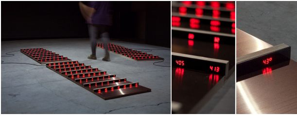
Figure 3 – La vague dans la matrice , 2019. À gauche : vue d'exposition, au centre : affichage des valeurs normalisées, à droite : affichage des températures.

langage Python). La simulation de tels modèles engendre à chaque itération le calcul de produits matrices-vecteurs. Le projet a entraîné une recherche sur la visualisation de telles matrices dans ce cas de simulation de vagues [3]. Il a permis des échanges sur les méthodes numériques et les applications les plus récentes développées au sein du LAMAV et du laboratoire Paul Painlevé, par exemple pour la simulation d'écoulements à faible Mach [4].