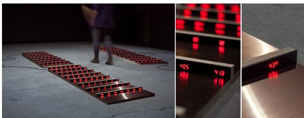
Figure 3 – La vague dans la matrice , 2019. À gauche : vue d'exposition, au centre : affichage des valeurs normalisées, à droite : affichage des températures.

langage Python). La simulation de tels modèles engendre à chaque itération le calcul de produits matrices-vecteurs. Le projet a entraîné une recherche sur la visualisation de telles matrices dans ce cas de simulation de vagues [3]. Il a permis des échanges sur les méthodes numériques et les applications les plus récentes développées au sein du LAMAV et du laboratoire Paul Painlevé, par exemple pour la simulation d'écoulements à faible Mach [4].