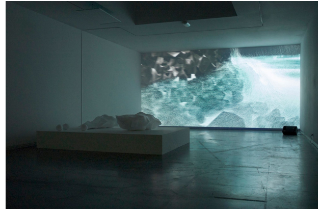
Figure 3 – En recherchant la vague , vue d'exposition à l'Espace Culture, Université de Lille, 2013.

équation, et à prolonger le travail de l'image numérique au-delà de la surface de l'écran, dans l'espace vécu par le spectateur. Le dialogue art-science qui s'est établi dans le projet ouvre de nouvelles investigations artistiques sur les aspects algorithmiques de la simulation de fluides.