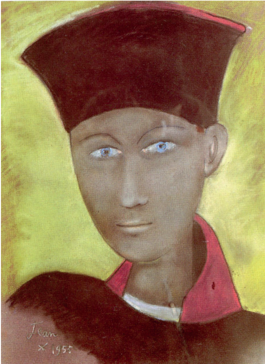
Jean COCTEAU, Jeanne d'Arc dans le costume de ses juges , pastel sur papier, 1955