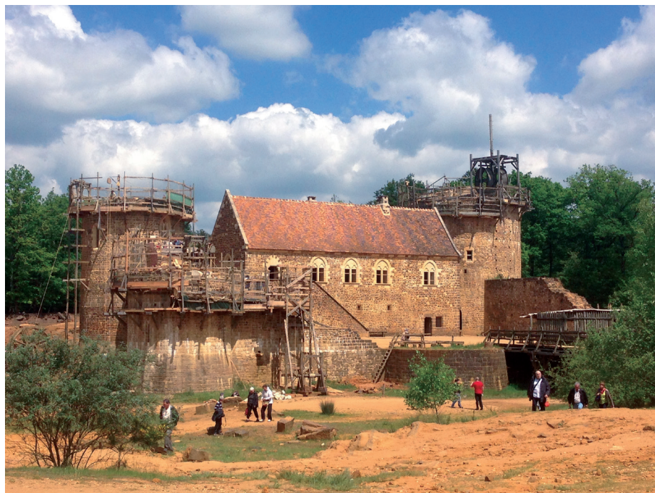
Fig. 3 — En mai 2016, vue générale du chantier 10 ans après.