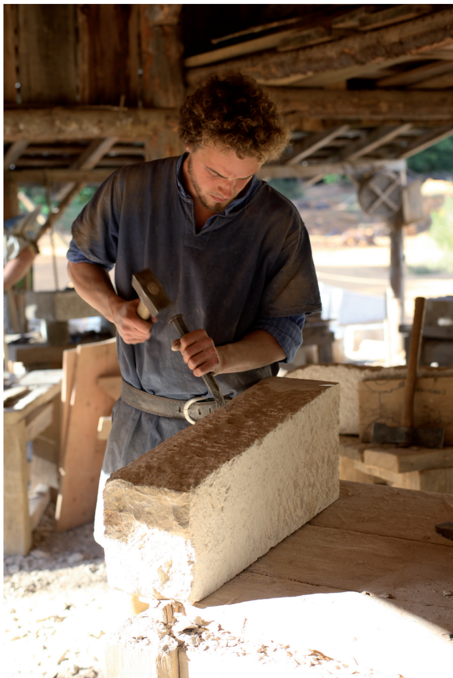
Fig. 6 — Tailleur de pierre avec massette et poinçon en loge de tailleurs de pierre © Clément GUÉRARD, Tailleur de pierre , 2017.