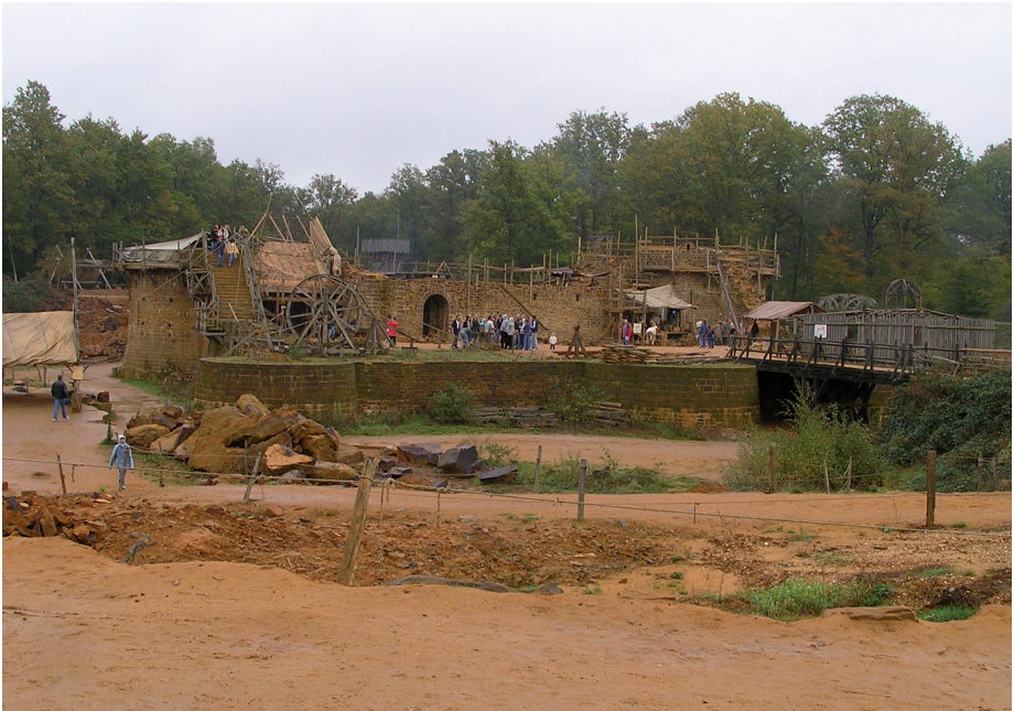
Fig. 2 — En 2006, vue générale sud du chantier. Photographie Emmanuel GLEYZE, 2006.