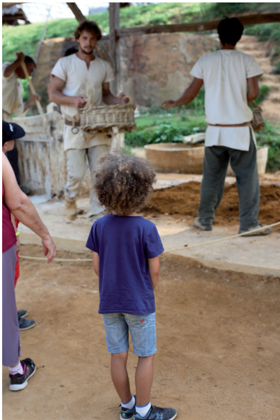
Fig. 8 — En 2017, près de 50 000 enfants sont venus visiter Guédelon en sorties scolaires.