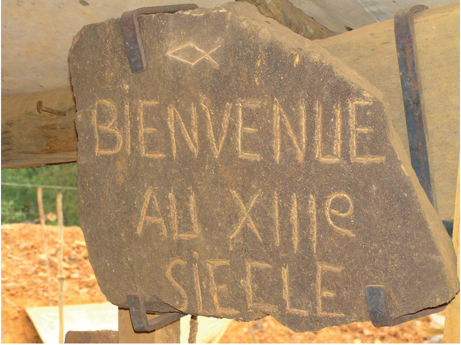
Fig. 1 — Le chantier de Guédelon : une ouverture sur le temps long du Moyen Âge ? , Photographie Emmanuel GLEYZE, 2006.