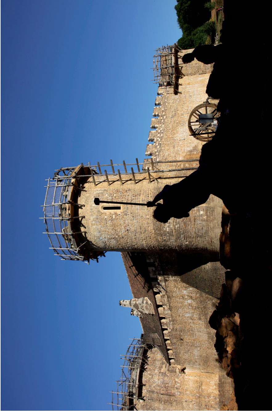
Fig. 7 — En 2017, en carrière avec vue sur la tour de la chapelle.