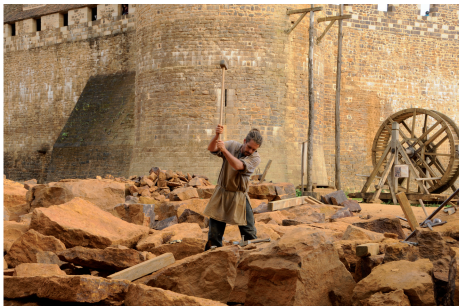
Fig. 4 — En carrière, quand la pierre résiste... © Clément GUÉRARD, Carrier , 2017.