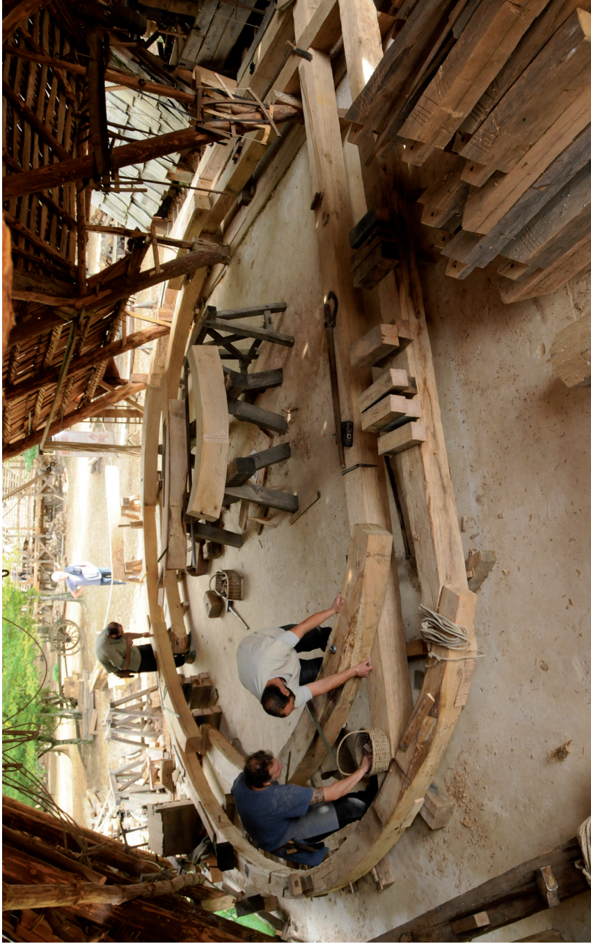
Fig. 5 — En 2017, charpentiers assemblant les éléments de la charpente de la tour de la chapelle. © Clément GUÉRARD, Charpentiers , 2017.