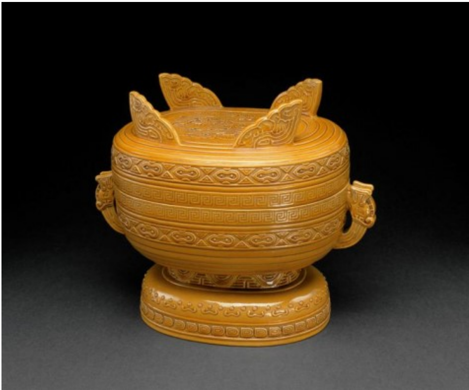
Vase en forme de gui à décor archaïsant. Porcelaine à couverte jaune, époque Qianlong (1735-1785), musée national des arts asiatiques – Guimet, collection Ernest Grandidier, G2850, Dimensions : 24 cm de haut, 28 cm de large.