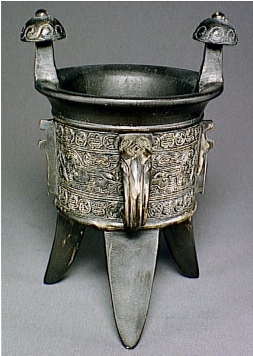
Coupe en forme de jia à décor archaisant, porcelaine à couverte imitant le bronze, époque Qianlong (1735-1785), musée national des arts asiatiques – Guimet, collection Ernest Grandidier, G3673, Dimensions : 18.5 cm de haut, 12.5 cm de large.