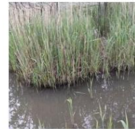
Figure 2. « Mur » réalisé par les élèves du groupe de MPS suite à la visite de la mare du jardin Serge Gainsbourg (Visible ici : https://fr.padlet.com/aurelie_zwang/kfr8dwwkqr0ma . Consulté le 15 décembre 2018)