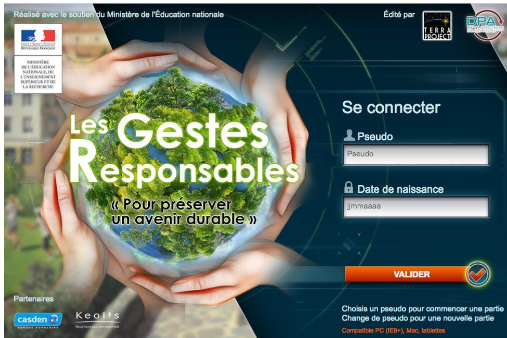
Figure 1. Page d'accueil d'un « green game » réalisé par Deyrolle et légitimé par l'Éducation nationale

l'objectif, contraire aux principes de l'approche systémique promue par l'éducation nationale, d'inculquer des gestes. Mais avec les dispositifs numériques, la problématique de la gratuité prend d'autres dimensions, entre les projets développés sous licences libres et les possibilités de collecte des données laissées par les utilisateurs aux fins privées de certains éditeurs.