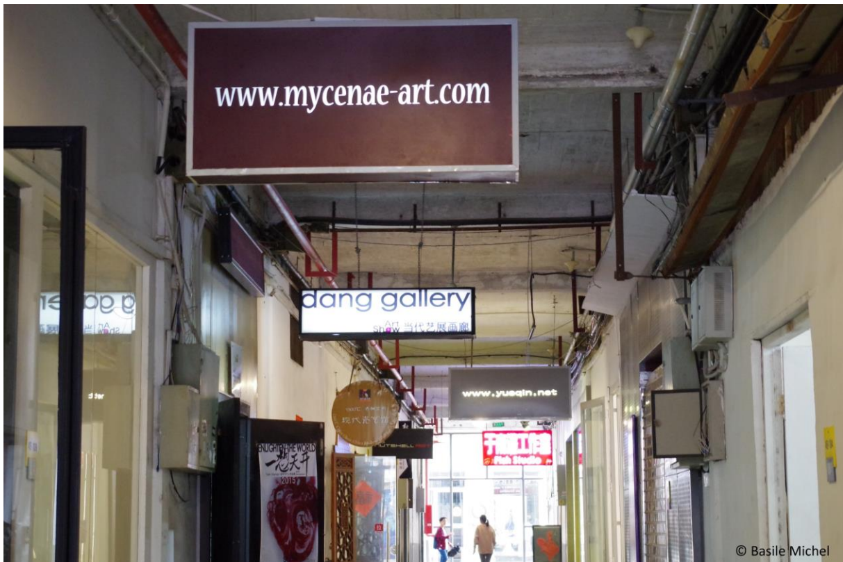
Figure 1. Ateliers d'artistes et galeries d'art au M50

Dans le quartier M50 à Shanghai, ce couloir d'un ancien atelier de filature de coton dessert aujourd'hui des ateliers d'artistes et des galeries d'art.