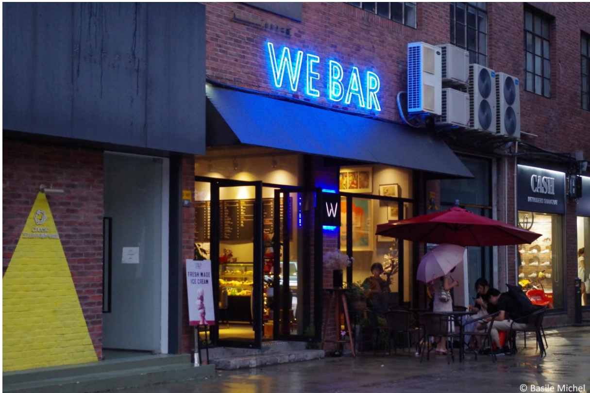
Figure 19. Café-bar ayant récemment remplacé une galerie d'art au M50