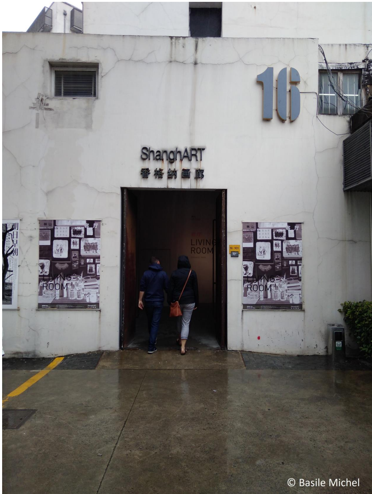
Figure 3. Entrée de la galerie d'art ShanghArt au M50