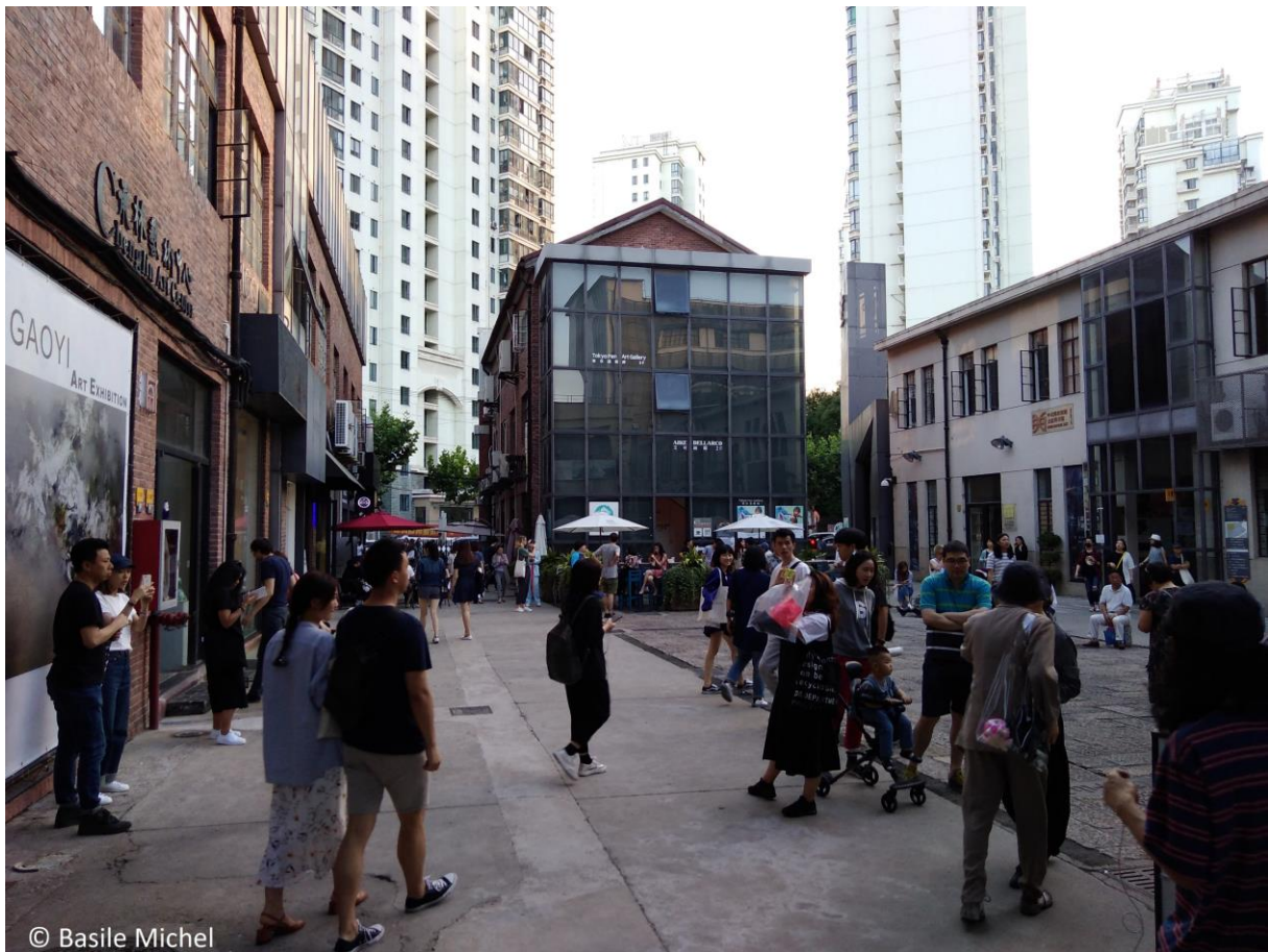
Figure 16. Touristes dans le quartier M50