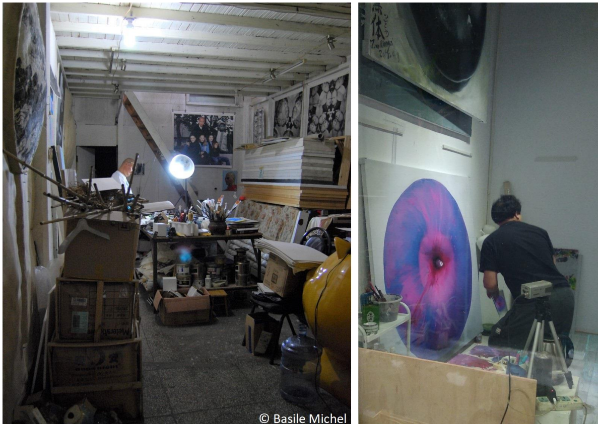
Figure 18. Des artistes chinois en train de travailler dans leurs ateliers au M50 : une image en voie de disparition ?