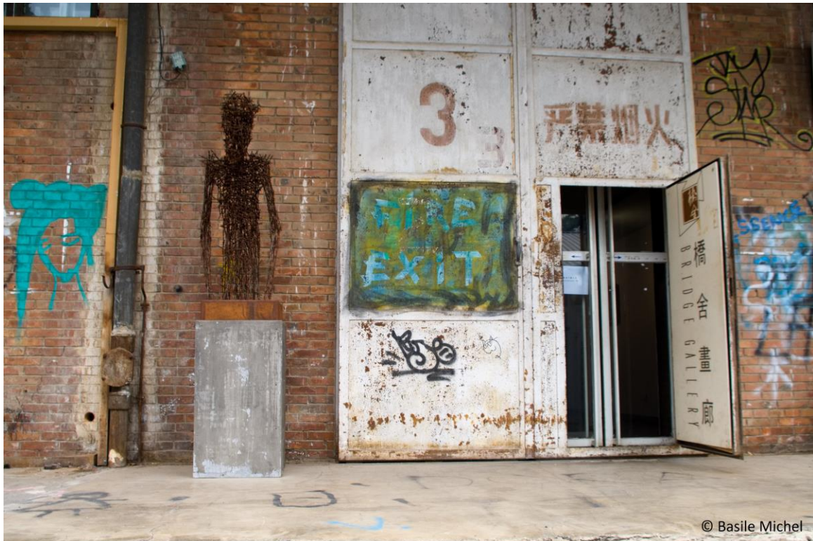
Figure 5. La symbolique post-industrielle : entrée d'une galerie installée dans le quartier 798