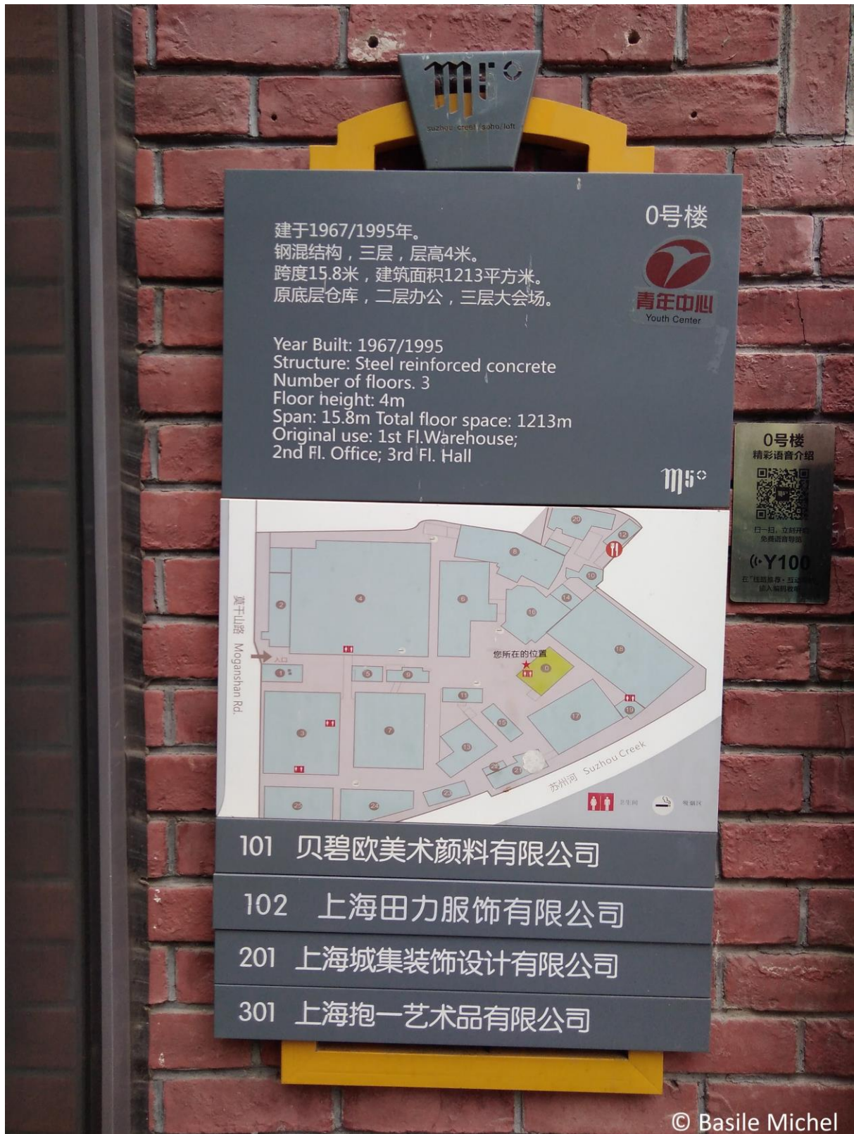
Figure 14. Panneau d'information pour les touristes au M50