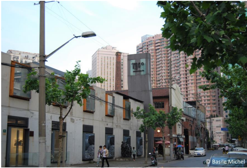
Figures 10, 11 & 12. La marque M50 s'affiche partout dans le quartier : dans les airs, sur les murs et au sol