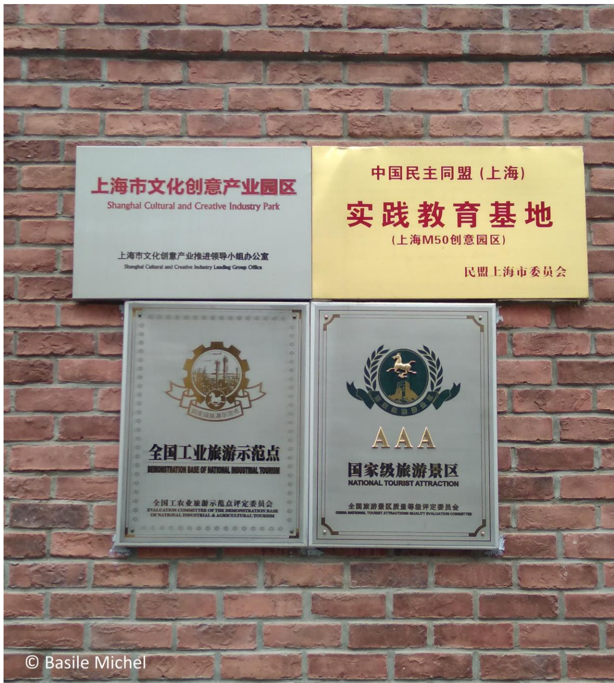
Figure 9. Labels affichés sur les murs du M50

À l'entrée du quartier M50, des plaques murales indiquent les labels officiels qui lui ont été attribués par les autorités.