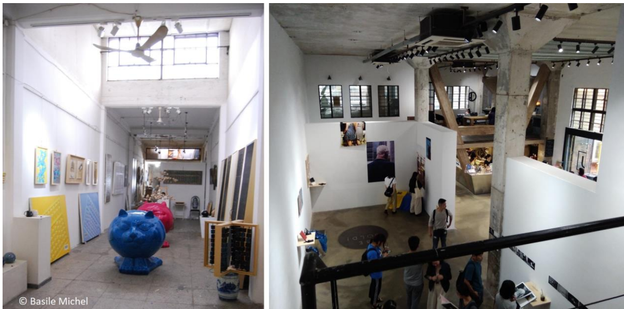
Figure 4. Intérieur de deux galeries au M50 : entre traces du passé industriel et œuvres contemporaines