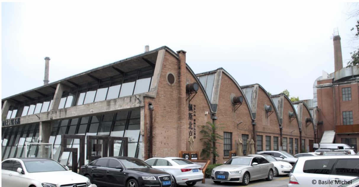
Figure 2. Galerie d'art au 798

Comme beaucoup d'autres, cette galerie d'art s'est installée dans un ancien bâtiment industriel de style Bauhaus caractéristique de l'architecture de l'usine 798 à Pékin. Source : photographie prise par Basile Michel, 2018.