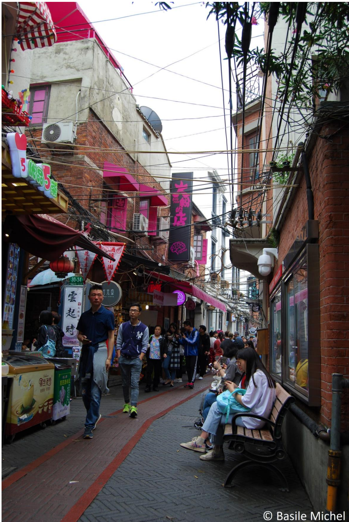
Figure 17. Une ruelle du quartier Tianzifang empruntée par des touristes