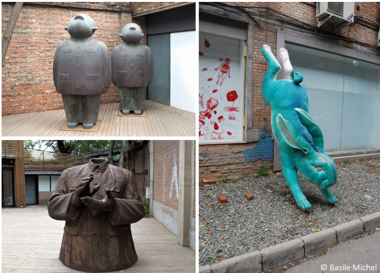
Figure 7. Œuvres d'art placées dans l'espace public du quartier 798

Les œuvres contemporaines parsèment les rues du 798 générant un sentiment d'immersion dans un territoire artistique.