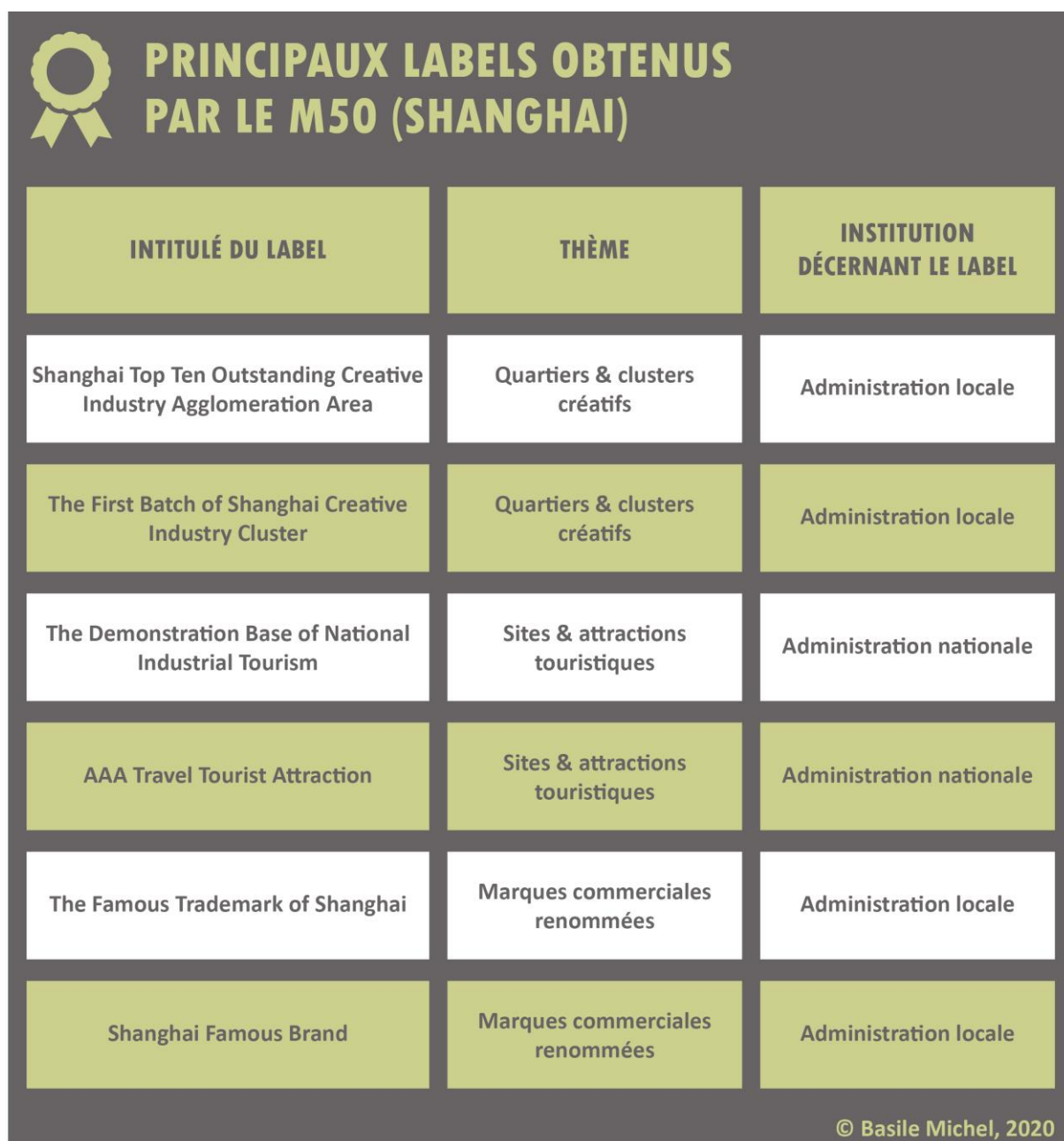
Figure 8. Tableau des principaux labels dont bénéficie le M50