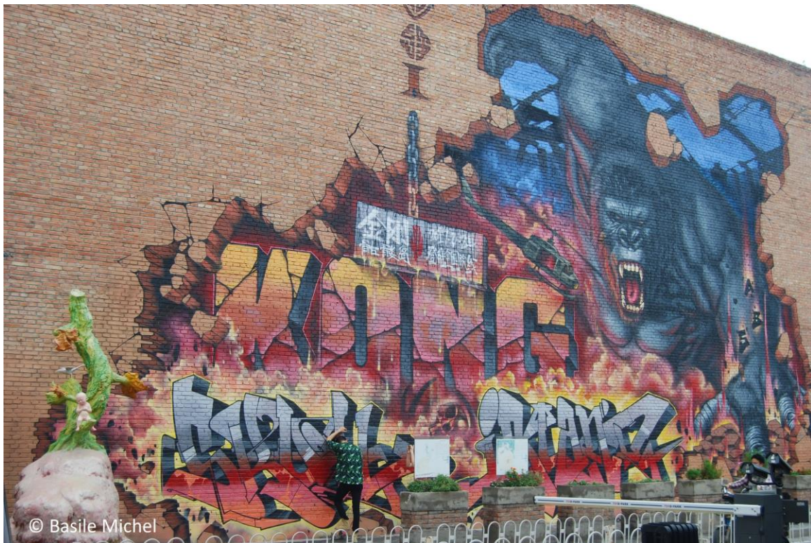
Figure 6. Graffiti dans le quartier 798

Dans les villes chinoises, les anciens quartiers industriels investis par des artistes et des galeries constituent les principaux lieux où des graffitis sont visibles, ici sur le mur d'un ancien bâtiment industriel en brique rouge du 798 à Pékin.