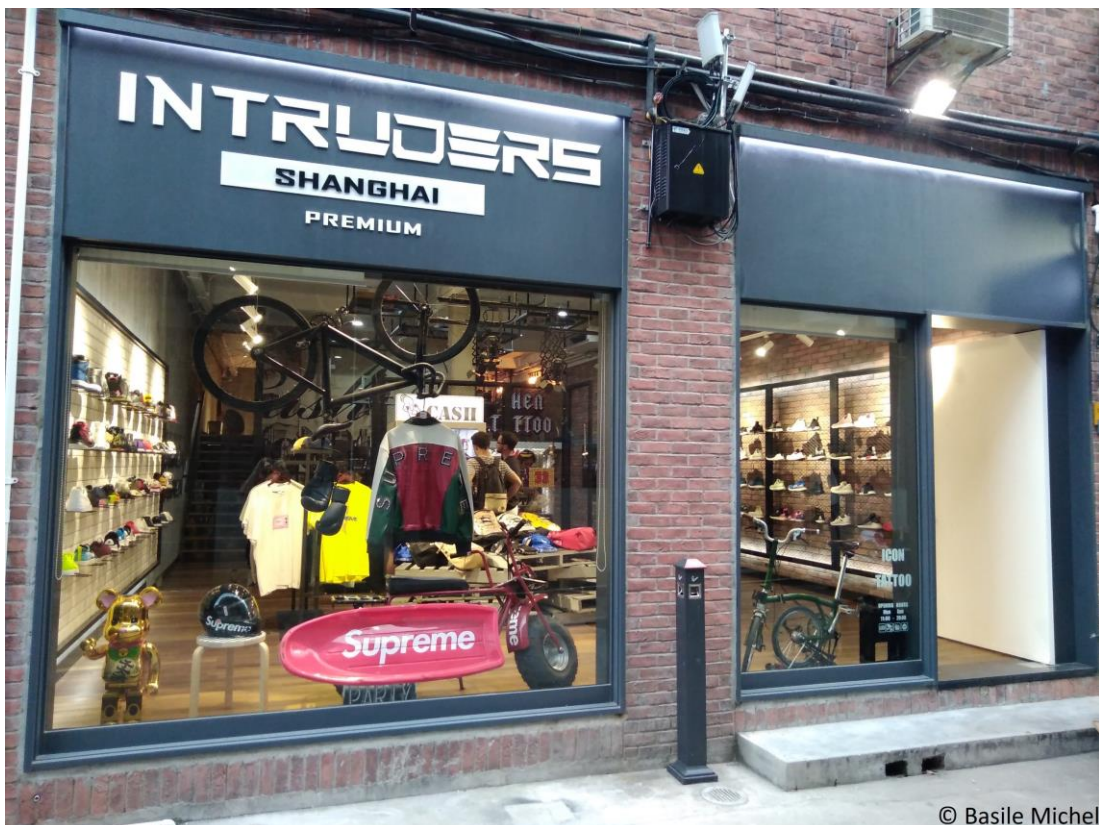
Figures 20 & 21. Magasin de chaussures et de vêtements au M50 et stand de glaces au 798 : des symboles de la gentrification commerciale des quartiers