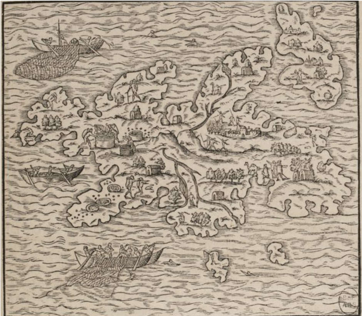
Fig. 1 : Carte de la pêche des perles, gravure tirée de l'édition imprimée de 1575 d'André Thevet, Cosmographie Universelle , Volume I, G. Chaudière, Paris, 1575, BnF, Livres rares, G-450, p.330a.