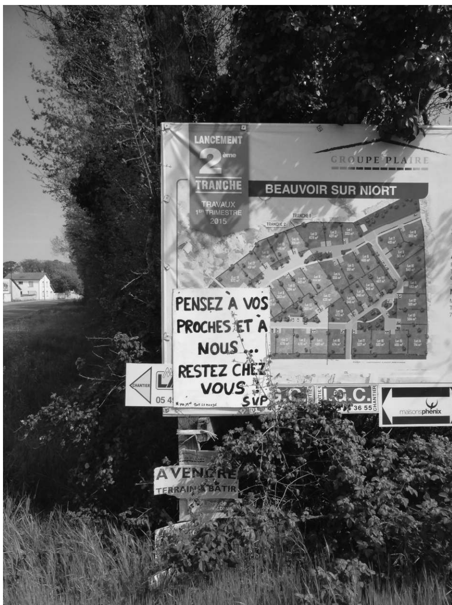
Fig. 3 : Deux facettes d'une même commune : le panneau « Pensez à vos proches » a été installé au tout début du mois d'avril 2020. L'astérisque sur le Nous* renvoie en bas à gauche à une sorte de « signature » : « M. Mme Tout le monde »