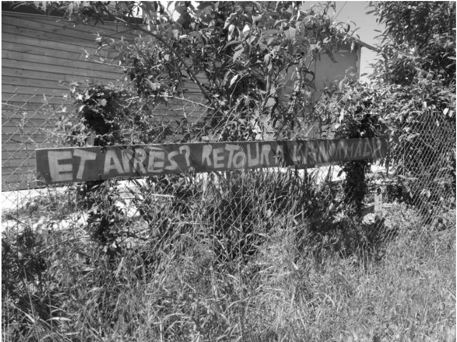
Fig. 4 : Deux facettes d'une même commune : le panneau « Et après ? Retour à l'anormal ? » a été installé la première semaine de mai 2020 sur la clôture d'un bâtiment « autonome », rénové en autoconstruction, sur la base d'une ancienne maison de garde barrière

À 20 heures, le « lotissement » tout entier applaudissait les soignants, alors que le vieux bourg restait aphone, peut-être même muet. Dans la journée, il y avait ceux qui « devaient » bouger et ceux qui « pouvaient » rester (Fig. 4).