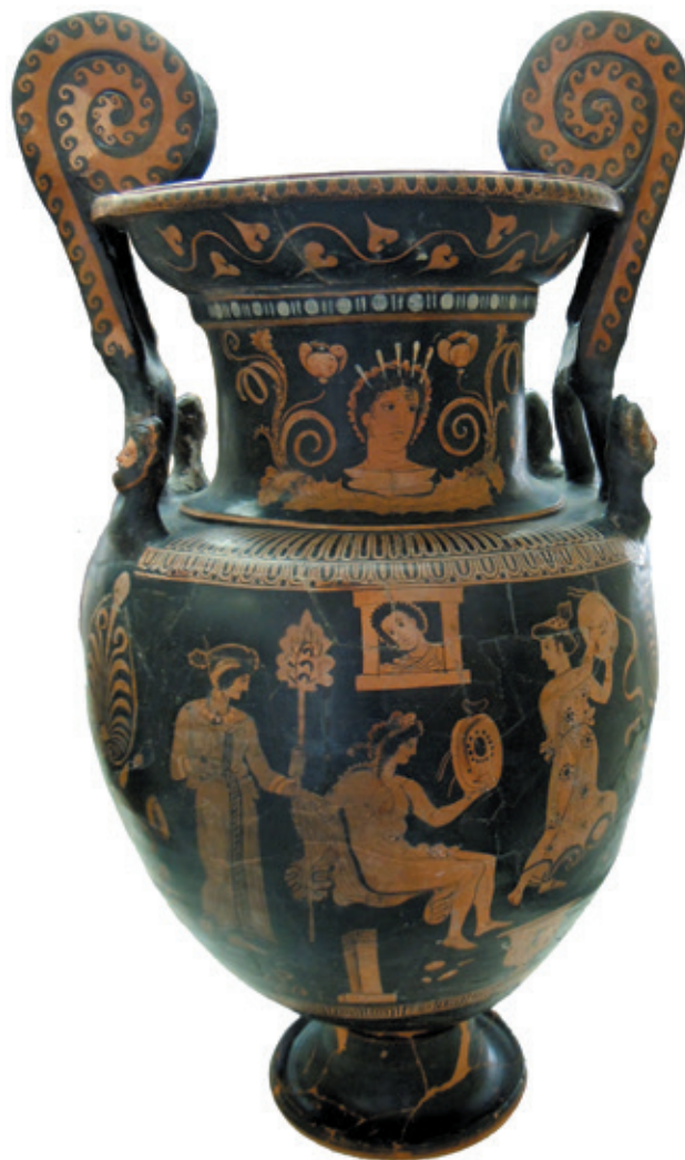
Fig. 2 - Cratère à volutes attribué au Peintre du Primato. Vatican, Museo Etrusco Gregoriano, inv. W1.

mauvaise gestion du four 8 , manque de maîtrise du processus de cuisson 9 , etc.) et trahit ainsi la présence au sein de l'atelier d'artisans au savoir-faire inégal.