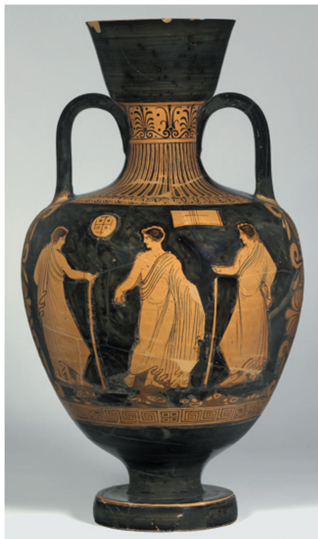
Fig. 3 - Amphore pseudo-panathénaïque attribuée au Peintre du Primato. Berlin, Altes Museum, Antikensammlung, inv. F3155.

d'intermédiaires entre ateliers et clients, fût-ce pour des trajets assez courts.