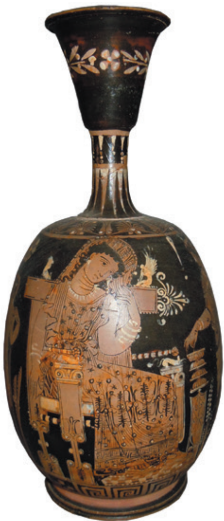
Fig. 1 - Lécythe aryballisque attribué au Peintre du Primato. Naples, Museo Archeologico Nazionale, inv. 81855.