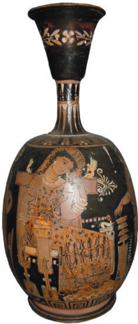
Fig. 1 - Lécythe aryballisque attribué au Peintre du Primato. Naples, Museo Archeologico Nazionale, inv. 81855.