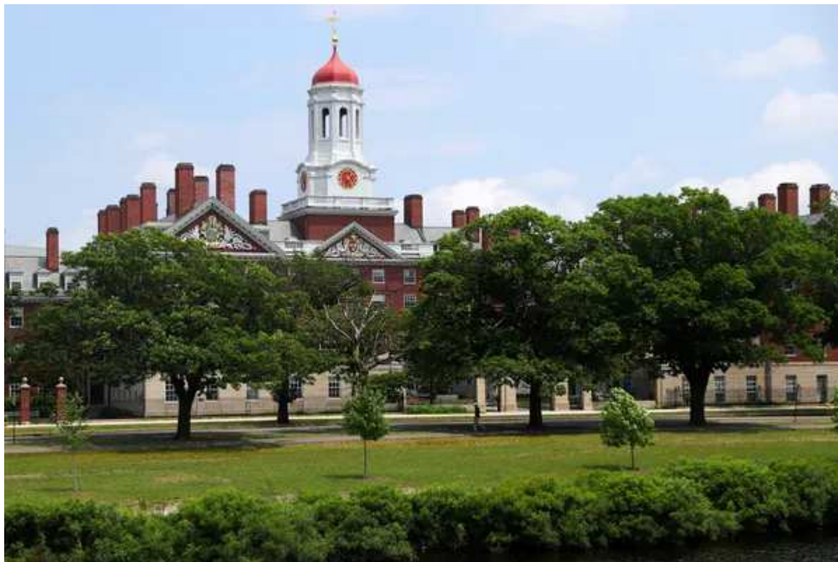
Vue du campus de Harvard (Cambridge, Massachusetts), membre de la prestigieuse Ivy League. Cette université a

La gestion de la pandémie a ajouté une difficulté supplémentaire à des candidats internationaux qui se heurtaient déjà pour beaucoup, depuis l'arrivée de Donald Trump à la présidence, à des interdictions de voyager, des décrets discriminatoires et une rhétorique officielle souvent xénophobe de la part de l'administration américaine.