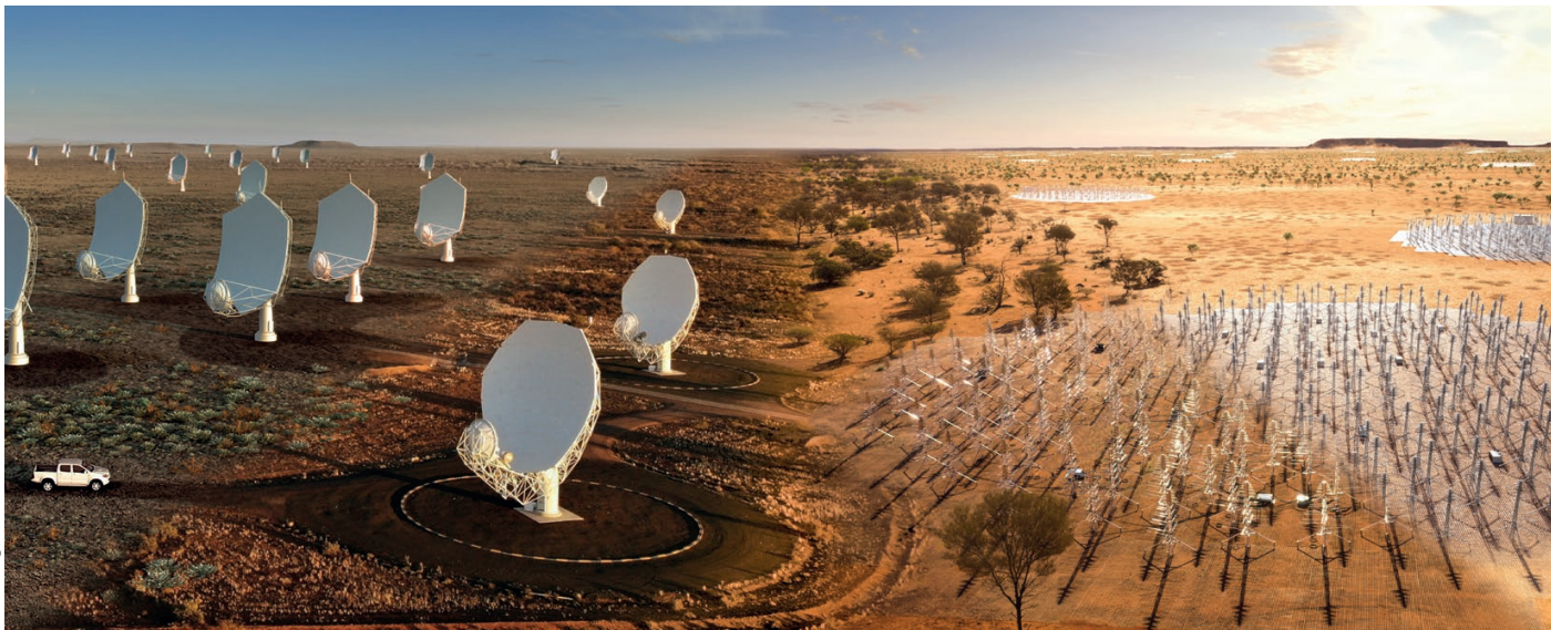
2. Impression d'artiste des paraboles de SKA-MID en Afrique du Sud (à gauche) et des antennes de SKA-LOW en Australie (à droite).

fabrication et de fonctionnement (liés en particulier à la consommation d'énergie et à la capacité de calcul) qui sont aujourd'hui prohibitifs pour la communauté scientifique. C'est pour cette raison que SKA1-MID sera constitué par un réseau de paraboles qui, à partir des années 1960, ont été le type d'antennes le plus utilisé en radioastronomie à haute et moyenne fréquence.