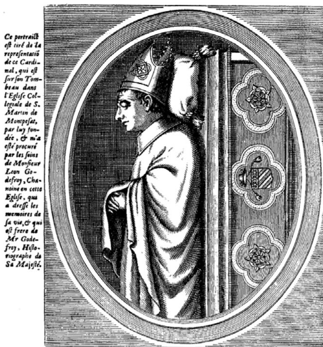
FIG. 6. — Frontispice du chapitre sur le cardinal Pierre des Prés, reproduisant sa tombe dans la collégiale Saint-Martin à Montpezat-de-Quercy, dans François Duchesne, Histoire de tous les cardinaux françois de naissance , Paris, 1660, liv. II, p. 436.