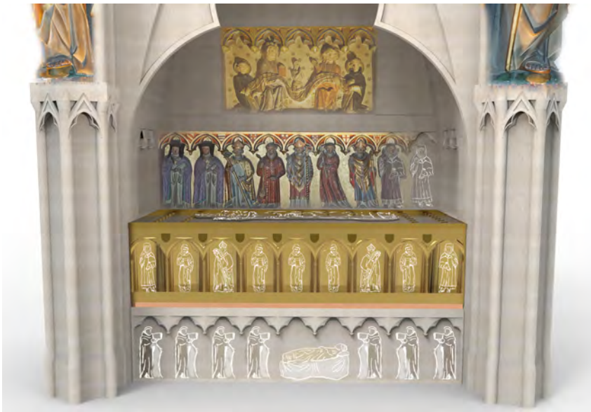
FIG. 3. — Restitution des parties disparues de la tombe du cardinal Hugues Aycelin († 1297), réalisée entre 1307 et 1311, dans l'ancienne église des Frères prêcheurs de Clermont

C'est en revanche un discours familial beaucoup plus complexe qui se développe sur la tombe du cardinal dominicain Hugues Aycelin dans l'église de son ordre à Clermont. Les restes du prélat mort à Rome en 1297 furent ramenés dans un second temps dans son Auvergne natale, conformément à ses dispositions testamentaires. Un magnifique enfeu fut réalisé pour marquer sa deuxième sépulture. Une partie du monument a disparu, mais elle est connue par une description du XVII e siècle due à François Duchesne : une caisse en métal émaillé, comportant une effigie du défunt entourée d'écus armoriés sur le couvercle et, sur le devant, un cortège de clercs et de laïcs sous des arcades reposait sur un soubassement en pierre où étaient représentés sept frères prêcheurs veillant le corps du cardinal, lui-même allongé sur un lit de parade (fig. 3).