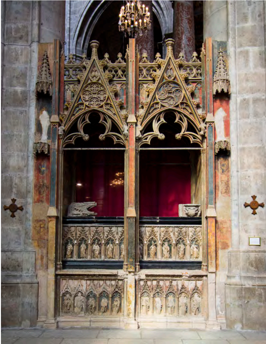
FIG. 1. — Tombe du cardinal Pierre de la Jugie († 1376), cathédrale Saint-Just, Narbonne