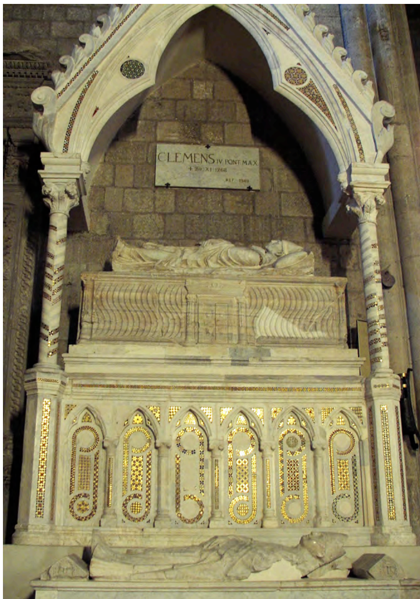
FIG. 2. — Tombes du pape Clément IV (†1268) et de son neveu Pierre le Gros, San Francesco alla Rocca, Viterbe