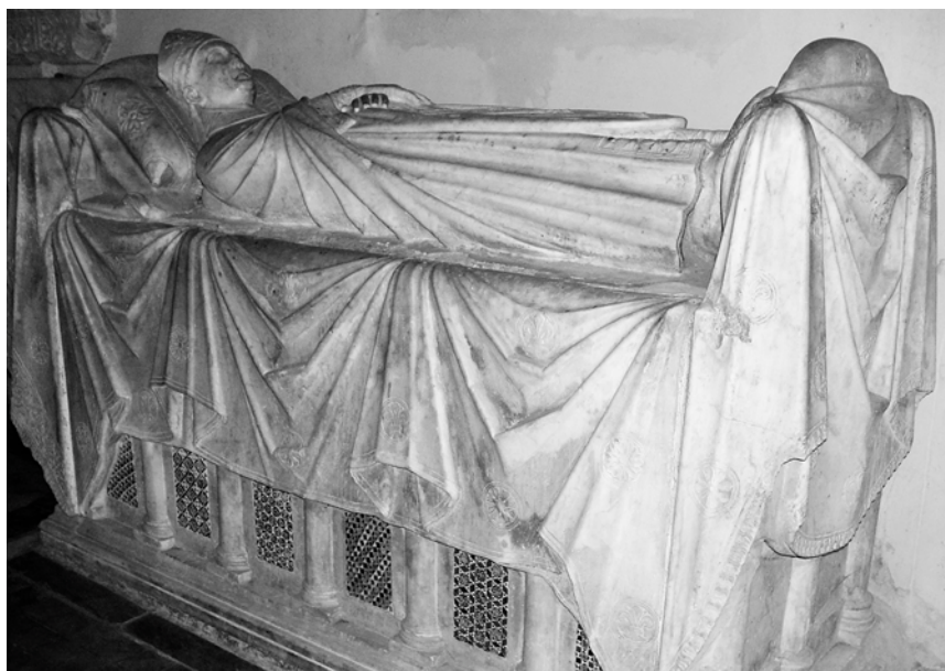
FIG. 5. — Tombe du cardinal Ancher de Troyes († 1286), église Sainte-Praxède, Rome