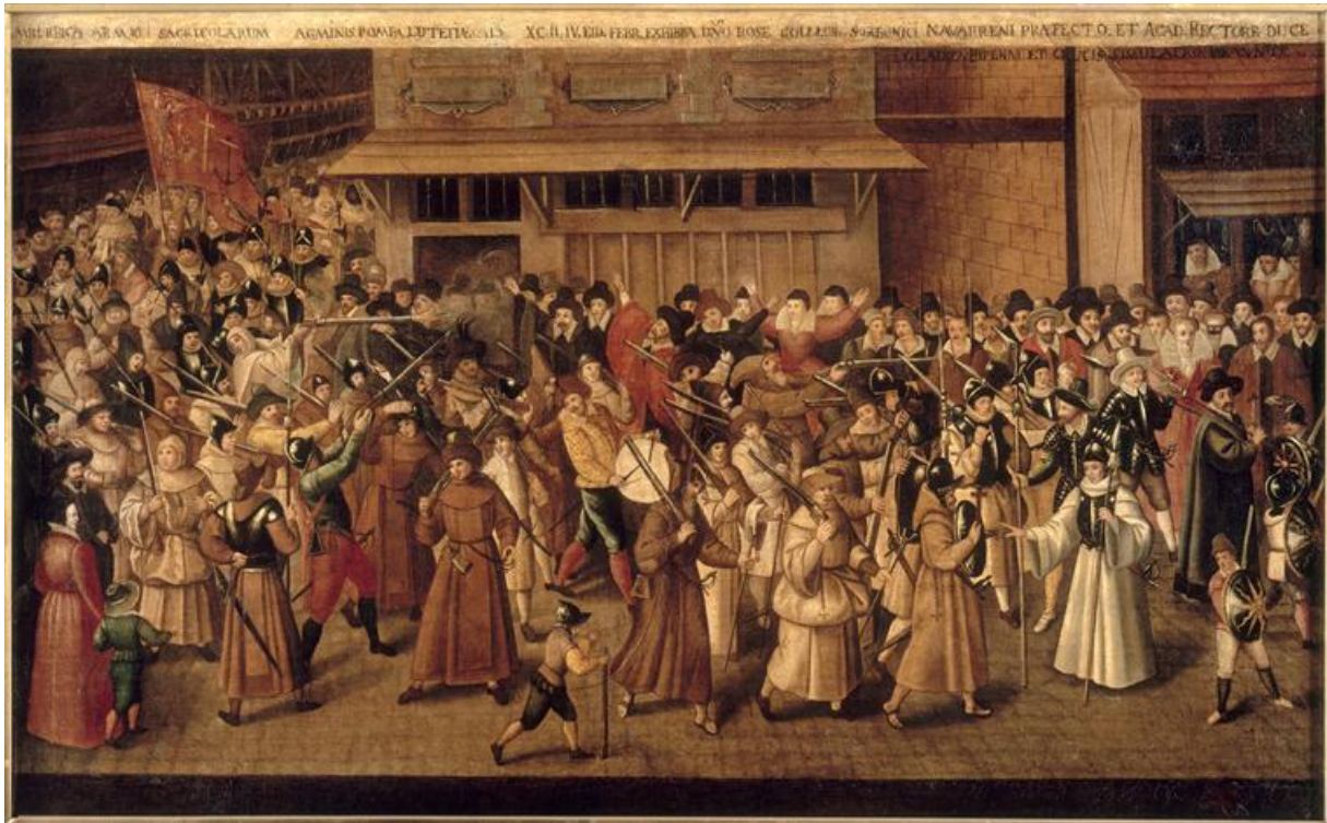
François II Bunel (vers 1552-avant 1599), La procession de la ligue dans les rues de Paris, le 4 février 1593 conduite par Guillaume Rose, huile sur toile (Château de Versailles)