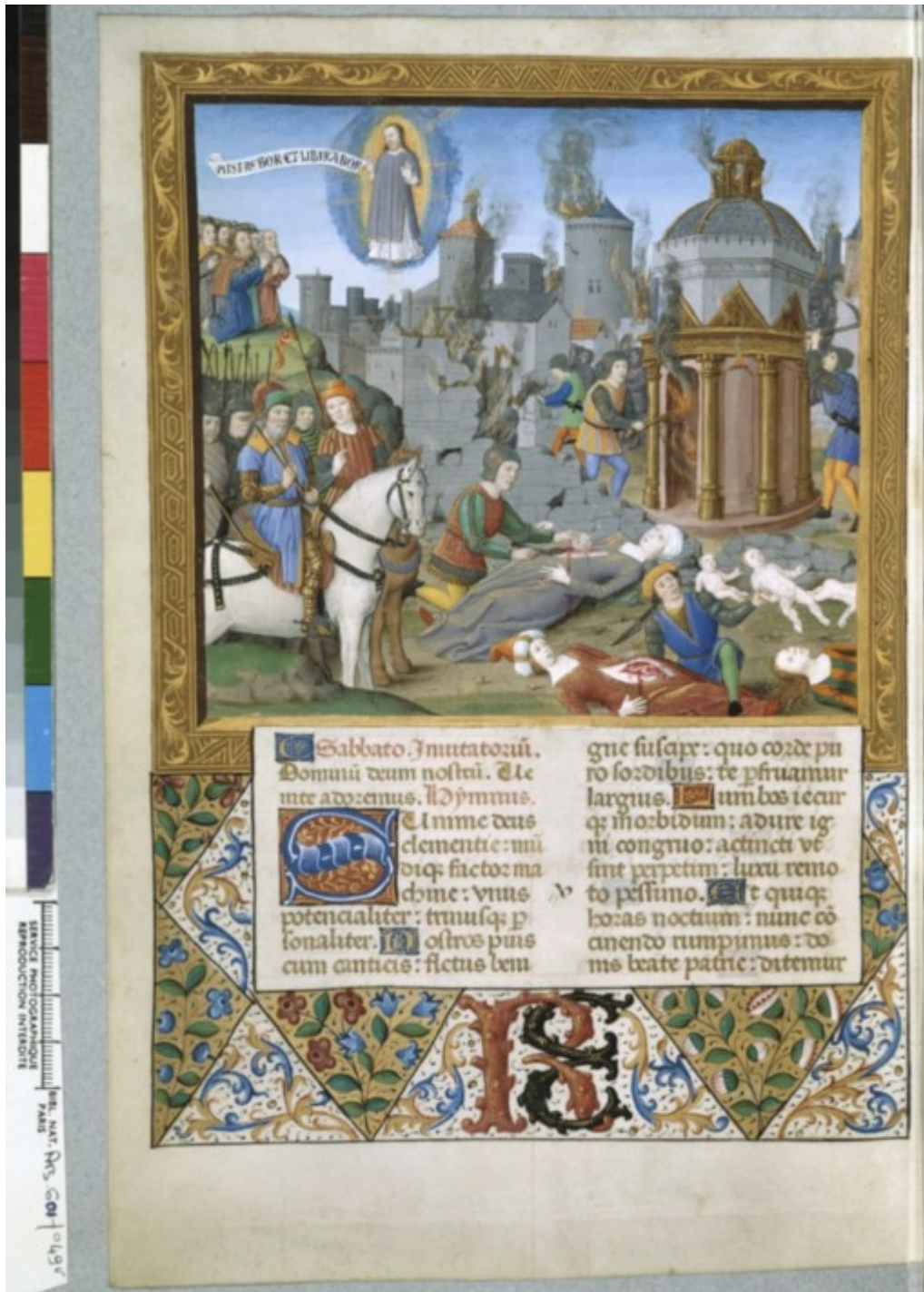
Sac et incendie d'une ville. (Breviaire de René II de Lorraine, Folio 49 verso, Manuscrit 601, BNF, collection du Marquis de Paulmy).