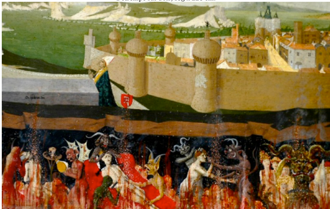
(Détail : Jérusalem)