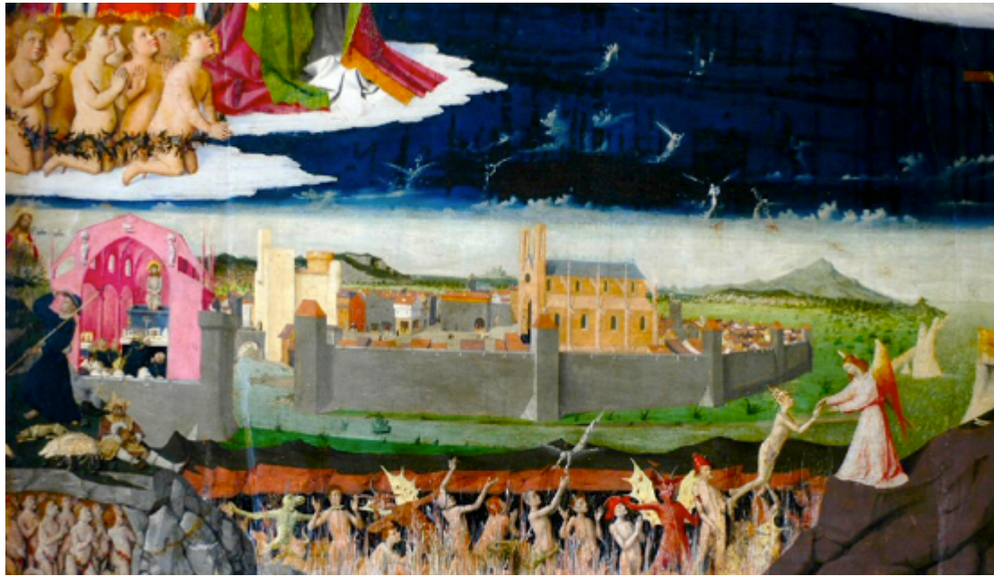
(Détail : Rome)