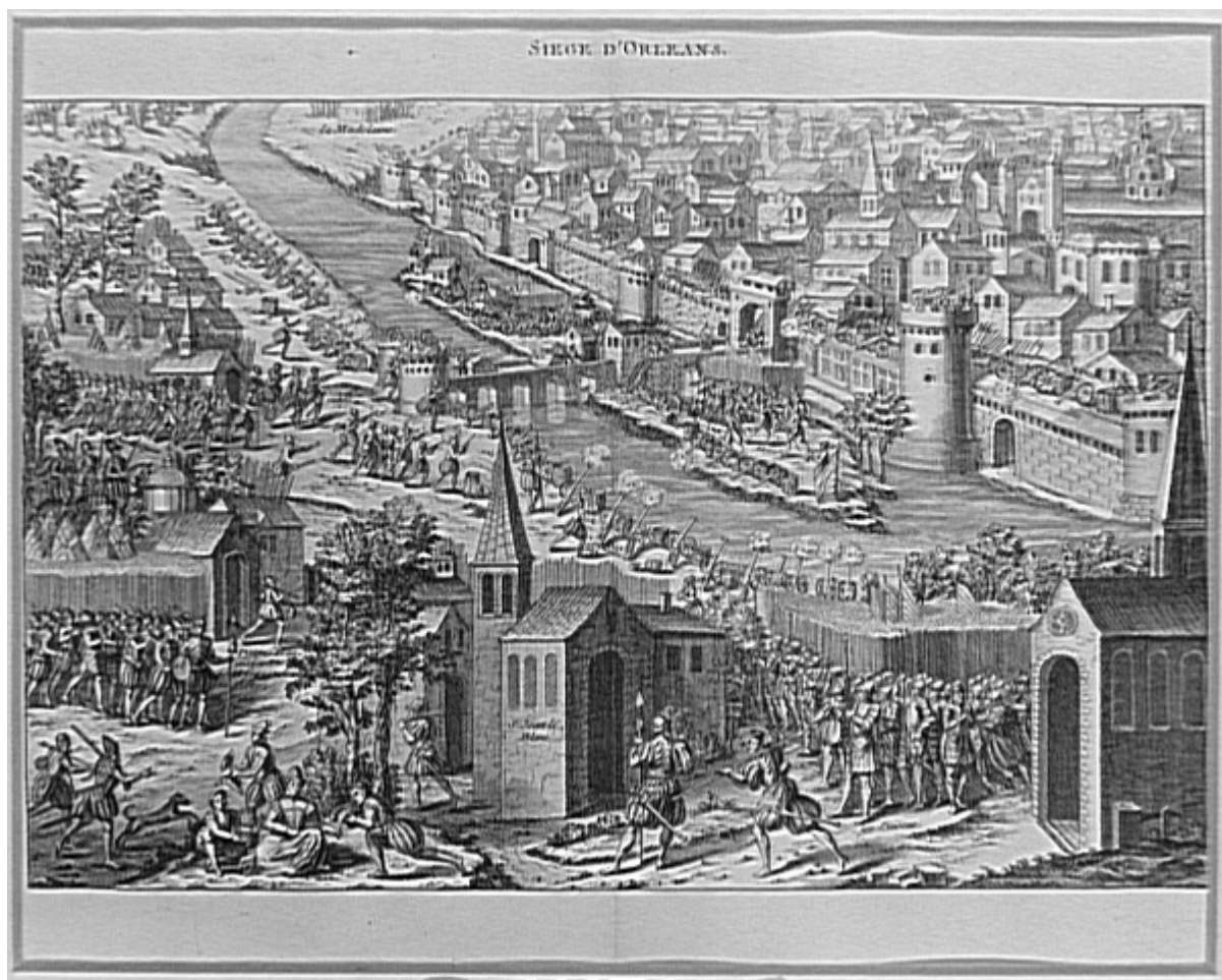
Le siège d'Orléans en 1562, Anonyme, estampe (Château de Versailles)