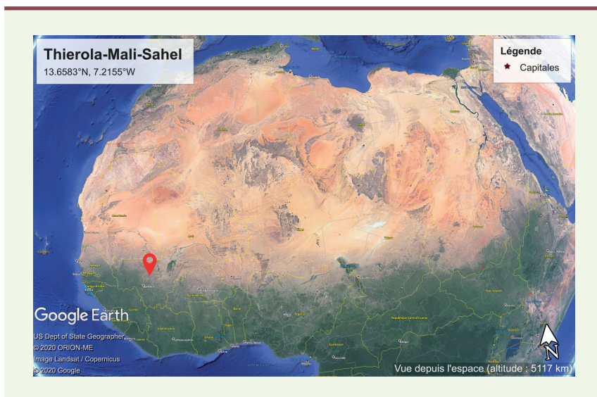
Figure 1. Localisation du site d'étude. Les captures de moustiques ont été réalisées autour de Thierola (point rouge) dans la partie sahélienne du Mali

par nuit. Quelle que soit l'espèce, plus de trois quarts des moustiques capturés étaient des femelles, dont 90 % avaient pris un repas de sang, mais aucune femelle anophèle n'était porteuse de Plasmodium . Contre toute attente, environ 10 % des moustiques capturés appartenaient à l'espèce An. coluzzii , tandis qu'un seul moustique An. gambiae s.s. avait été collecté. La majorité des anophèles capturés appartenaient à des espèces vectrices mineures de P. falciparum : An. squamosus , An. pharoensis et An. coustani . En utilisant les valeurs des densités nocturnes moyennes de moustiques capturés à différentes hauteurs et les vitesses de vent réelles estimées, les auteurs ont évalué l'intensité de la migration nocturne. En se fondant sur une distance de 100 km, correspondant à la distance entre deux des sites d'étude, les migrations annuelles ont été estimées à plus de 80 000 individus pour An. gambiae s.s. , 6 millions pour An. coluzzii et 44 millions pour An. squamosus . Si une telle ampleur de migration peut sembler gigantesque, les migrations massives d'insectes sont néanmoins bien documentées, comme en témoigne l'estimation de 3 500 milliards d'insectes migrant chaque année dans le sud de l'Angleterre à des altitudes com-