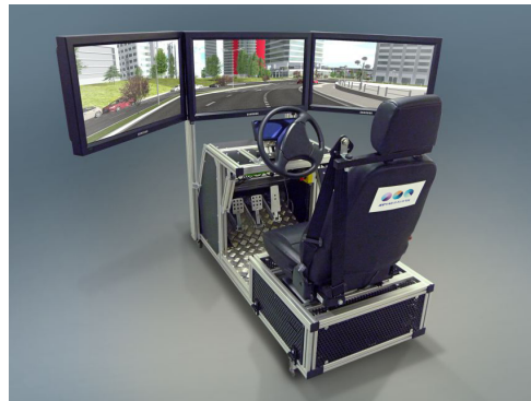
Figure 1 – Simulateur de conduite CompactSim pour simuler un passager-superviseur transporté par un véhicule autonome et connecté.

Le projet C2C se focalise sur les environnements urbains dans lesquels l'infrastructure routière est partagée à la fois par des véhicules