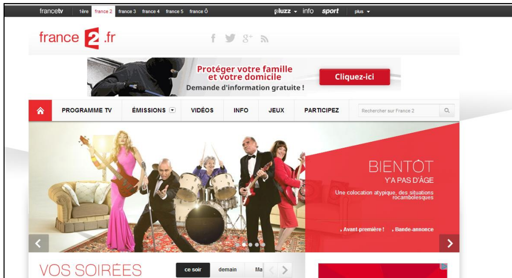
Image 1- Capture d'écran du haut de la page d'accueil sur site Internet de France 2 le 25/08/13.

Le second bandeau met en valeur le logo de la chaîne, ainsi que ceux des réseaux socio-numériques les plus emblématiques : Facebook, Twitter, Google+.