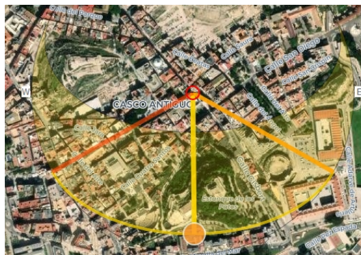
Cartagena, sorgere e tramontare del sole (orizzonte astronomico) al solstizio d'inverno, come mostrato da suncalc.org.

Nicopolis . Chi ora scrive l'ha studiata in dettaglio 59 . In letteratura precedente si trova definita come allineata col sorgere del sole al solstizio d'inverno ma non è così. Gli azimut solari portano alle date del 2 Novembre e del 7 Febbraio. Tra la direzione del decumano e quella del sorgere del sole al solstizio d'inverno c'è una differenza di dodici gradi. E sono tanti. Sarebbe stato molto bello trovare un allineamento col sorgere del sole il giorno della battaglia di Azio, il golfo dove sorge Nicopolis, ma non è così.