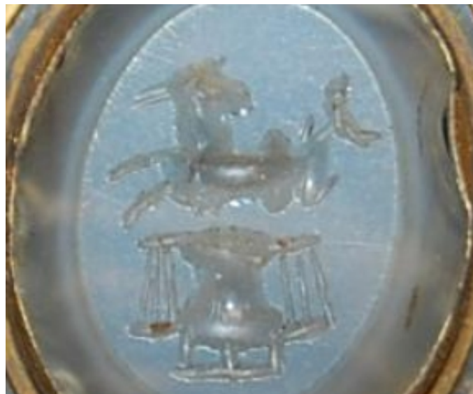
A gem from the Collections of the British Museum (number 1923,0401.329). It is a chalcedony gem engraved with Capricorn and Libra. Roman Imperial period.