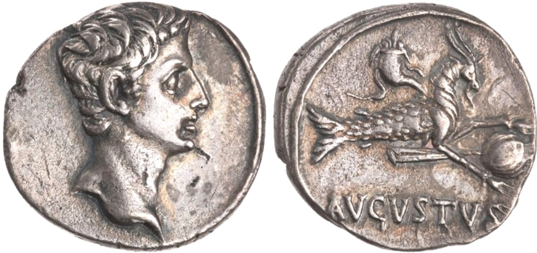
Denarius Issued by Augustus: Capricorn Holding Globe. Minted in Colonia Patricia (Cordoba, Spain), 18–17 BCE.

L'immagine mostra il globo con le linee dei paralleli, come dalla geografia di Eratostene. Parallelo e meridiano si vedono nell'immagine seguente.