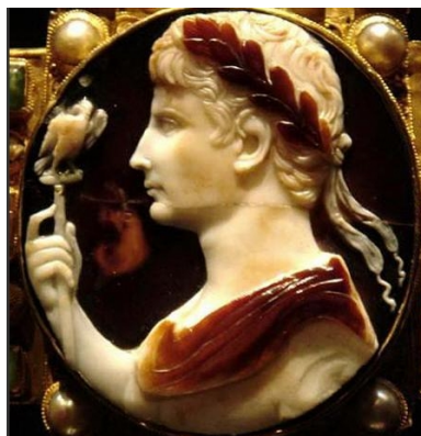
Un cameo. 20

Il discorso fatto da Magini è chiaro, e ci dice che i dieci mesi erano sinodici e che nel decimo mese avveniva il parto. Attenzione, dieci mesi sinodici (ma in questo caso completi) era il periodo di tempo che le vedove dovevano, per legge, aspettare per risposarsi. Questo era il mondo romano. Anche Azia, la madre di Augusto, avrà contato le lune ed arrivata la decima si sarà preparata all'arrivo del figlio. Era la luna, non il sole a scandire l'attesa.