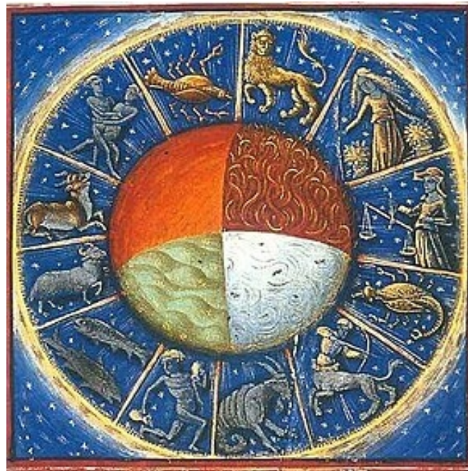
The four elements of the Earth with the twelve signs of the zodiac, from De Proprietatibus Rerum by Bartholomeus Anglicus, 1445-50.

Sul suo oroscopo, dice Svetonio, Augusto aveva consultato Teogene ad Apollonia. In base a quale calcolo avrà deciso l'astrologo? Svetonio non riporta dettagli. Come avrà assegnato il Capricorno ad Augusto? Non era il segno della data di nascita, ovviamente. Sarà stato un ascendente? Molti pensano che sia così, ed è anche stato proposto che il Capricorno fosse il segno in cui si trovava la Luna, quando Augusto era nato.