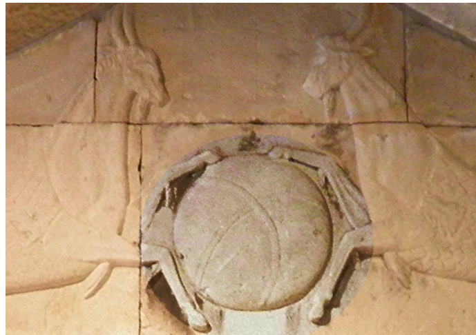
Typanum of a funerary monument built in the form of a temple with representation of two Capricorns, Romisch-Germanisches Museum, Cologne. Uploaded by Marcus Cyron in Wikipedia. Image author, Carole Raddato from Frankfurt, Germany.

L'immagine mostra il globo con le linee dei paralleli, come dalla geografia di Eratostene. Parallelo e meridiano si vedono nell'immagine seguente.