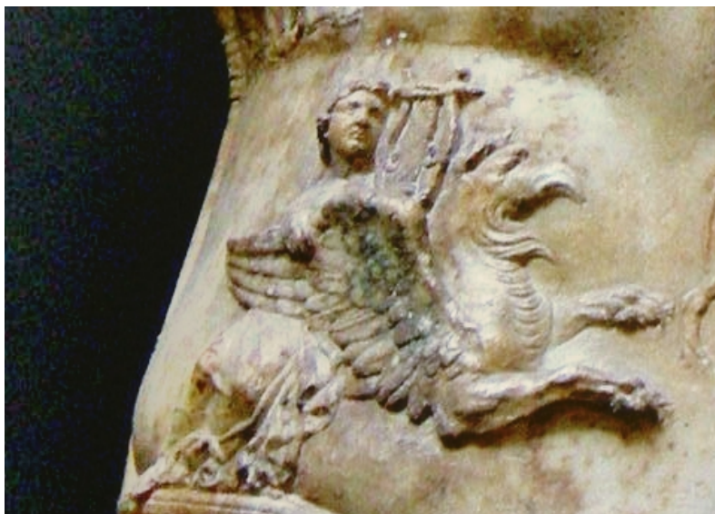
Dettaglio dall'immagine