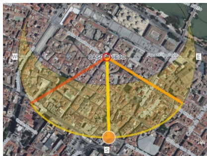
Saragozza, sorgere e tramontare del sole (orizzonte astronomico) al solstizio d'inverno, come mostrato da suncalc.org.

Caesaraugusta (Zaragoza, Saragossa). Era città dell'Hispania Tarraconensis, tra Celsa e Turiaso. "Trasse il nome dall'avervi Augusto fondata una colonia finita che fu la guerra Cantabrica (Isid. orig 15,1), siccome è provato anche dalle monete (Heiss, Monn. antiq. de l'Espagne tav. 24,18; 25,33), che mostrano esservi stati dedotti militi delle legioni IV, VI e X. Colonia immunis la chiama Plinio (I. c)". Era iscritta nella tribù Aniensis. Le poche lapidi locali e non locali confermano il titolo di Colonia Caesaraugusta. (Dizionario Epigrafico di Antichità Romane - Ettore De Ruggiero - 1886). La città ha il decumano orientato col sorgere del sole al solstizio d'inverno.