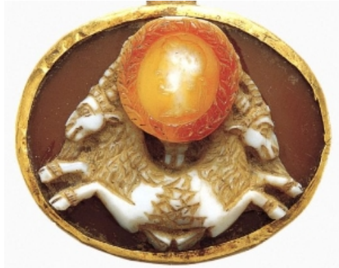
Sardonyx cameo of a double capricorn with a portrait of the emperor Augustus 21