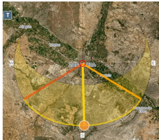
Saragozza, l'asse lungo del territorio ed il sorgere del sole al solstizio.

Augusta Raurica). Certo, dice Le Gall, la direzione è la stessa del sorgere del sole al solstizio d'inverno, ma aggiunge che è anche la direzione di una via. E si può aggiungere che è anche la direzione dell'asse lungo del territorio, come si vede dalla seguente immagine. I Romani non avevano grande scelta nell'orientazione della città.