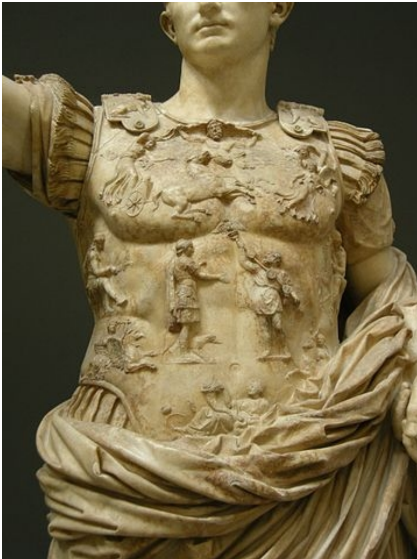
Augustus of Prima Porta statue, now in the Braccio Nuovo of the Vatican Museums, Rome.

Per Augusto, il 23 Settembre era un giorno molto importante, tanto da festeggiarlo con Apollo e un tempio. E il solstizio d'inverno, era importante? Non ci sono dediche relative esplicite.