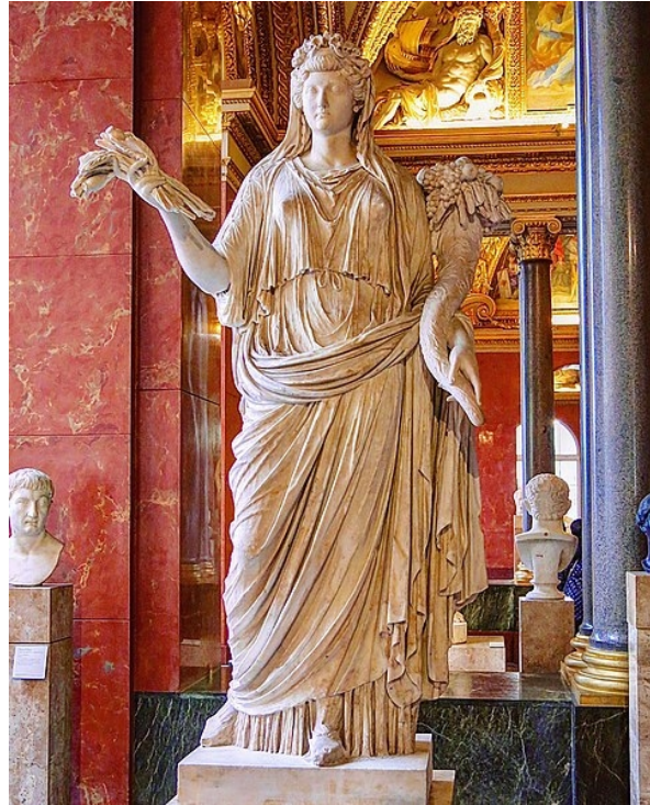
Statua di Livia, moglie di Augusto, come Opi/Cerere, dea della fertilità, con cornucopia, capo velato, corona d'alloro e spighe di grano, Louvre.