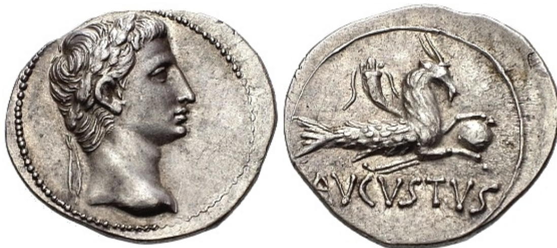
Tra le zampe del Capricorno c'è il globo terraqueo non il sole.

Torniamo a Svetonio. Secondo il suo racconto, una volta assegnatogli il Capricorno come segno zodiacale, Ottaviano fece coniare una moneta con la sua immagine. In alcune monete c'è solo il Capricorno, l'essere ibrido, mezzo capra e mezzo pesce, sia terrestre che acquatico; in altre monete, l'iconografia sottolinea maggiormente come il Capricorno venga a simboleggiare il dominio sulla terra e sul mare, ovvero sul globo terraqueo, in particolare dopo la battaglia di Azio. In alcune coniazioni infatti il Capricorno regge il globo, ossia il mondo, tra le sue zampe e magari ha anche un timone, simbolo di governo, e sulle sue spalle una cornucopia dell'abbondanza. Timone e cornucopia erano simboli della Fortuna.