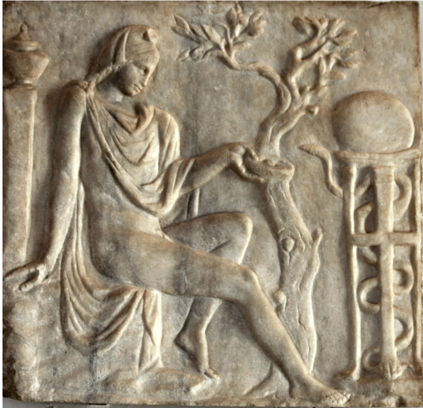
Fianco di sarcofago con raffigurati Apollo e il serpente, metà del II sec. d.C. Ancient Roman relief in the Museo Archeologico Nazionale (Venice)

Nonostante le parole di Svetonio e di Gellio, si potrebbe assumere un modello di concepimento come quello cristiano per l' Annunciazione, con nove mesi prima del Natale in un calendario giuliano solare. La data al 25 Marzo dell'Annunciazione è infatti in relazione al Natale. Tale data è dovuta alla tradizione della Chiesa, mancando al riguardo riferimenti precisi nei Vangeli.