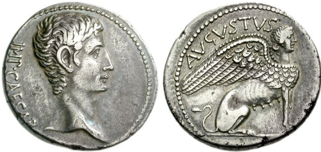
Augustus. Pergamum mint. Struck 27-26 BC. IMP • CAESAR, bare head right / AVGVSTVS, sphinx, with raised wings, seated right.