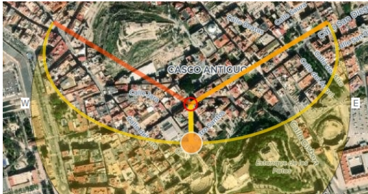
Sorgere e tramontare del sole (orizzonte astronomico) al solstizio d'estate, come mostrato da suncalc.org

Non c'è orientazione col solstizio d'inverno.