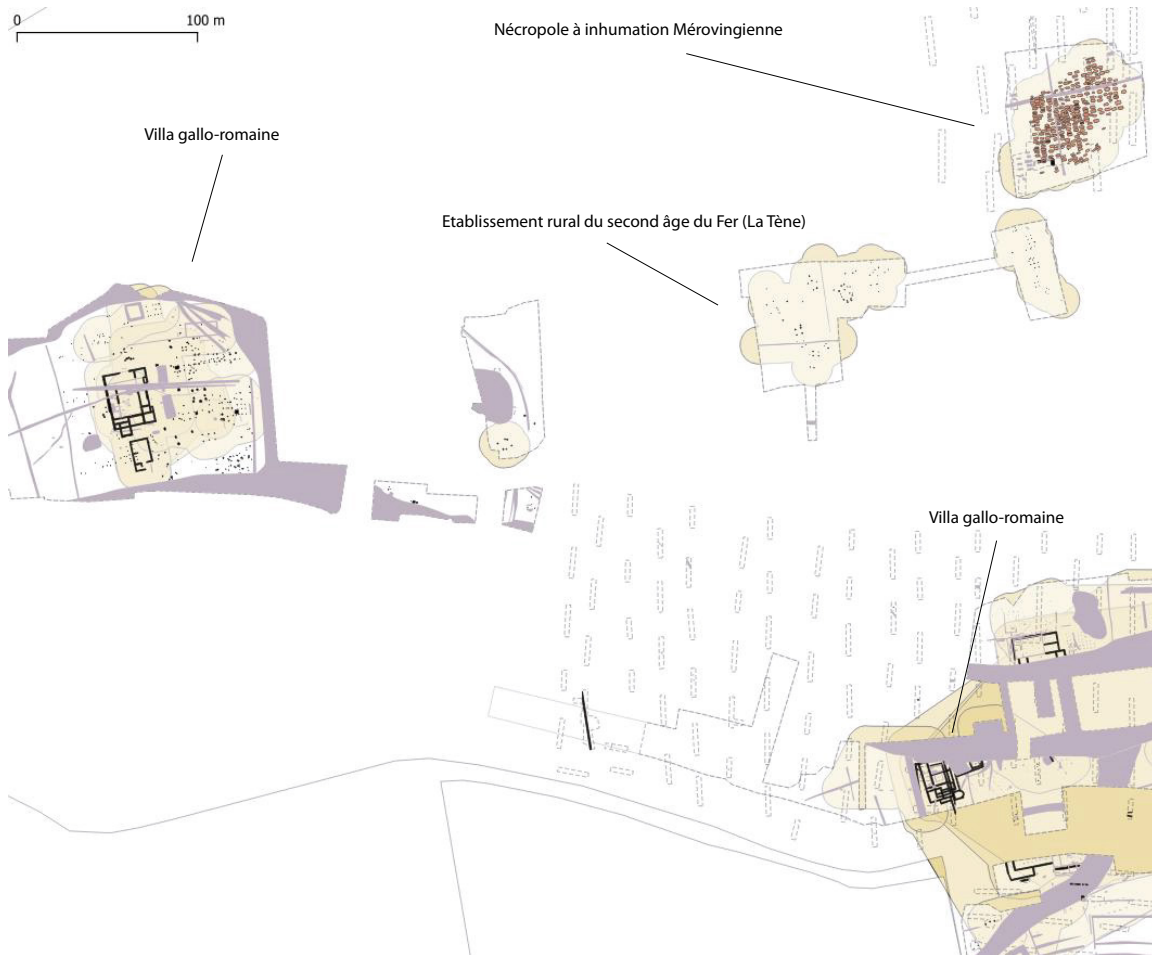
Figure 2. Les occupations archéologiques de Norroy-le-Veneur (57)

Le volet spatial permet de visualiser les zones d’implantation préférentielles. Réciproquement, on peut mettre en évidence les zones de répulsion ou de désintérêt et les changements respectifs d’attraction à répulsion, ou inversement, à travers le temps.