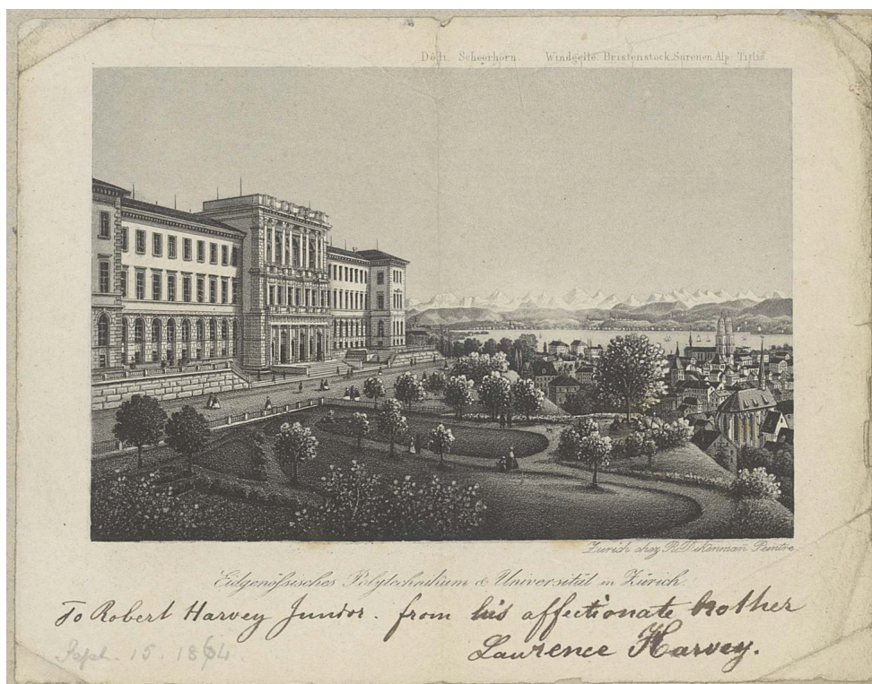
Fig. 1. – Vue du Polytechnikum de Zurich, envoyée par L. Harvey à son frère le 15 septembre 1864.