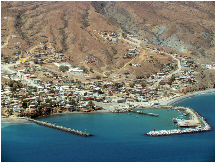
Figura 4. Los dos asentamientos de la Isla de Cedros son el pueblo de pescadores en el litoral este (izquierda) y El Morro en la Punta sureste (derecha). Fotografías: Nasheli Baxin, 2019

Cuando la “Pesquera del Pacífico” terminó sus funciones en los años 90, la emigración causó efectos en la demografía y en la economía local: muchas personas se fueron a otras ciudades de Baja California, principalmente a Ensenada, donde se encuentra una gran cantidad de isleños, negados a desarraigarse de “El Piedrón”, topónimo alternativo y no oficial. El censo más reciente (2010) reporta una población de 2 mil habitantes entre ambas localidades de la isla de Cedros (fig. 4).