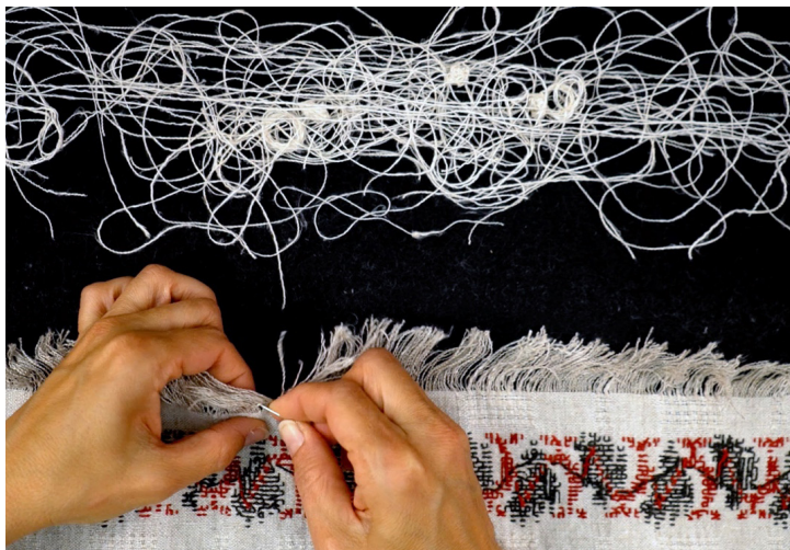
Figure 1. Extrait de la vidéo Dé-tisser , HD, 2018, 20' 18"

dans un tiroir, je ne pouvais l'utiliser comme une vulgaire serviette. Puis, je l'ai dé-tissé pour que ses fils redevennent plantes.