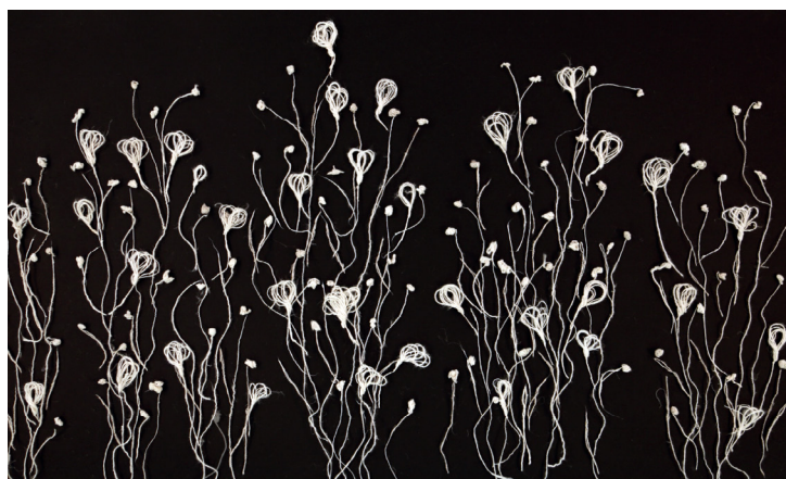
Figure 3. Extrait de la vidéo Champ de lin , HD, 2018, 5' 22"

du tissu (fig. 4). D'un côté, on voit les fruits mûrs tels que remémorés dans le récit passionné de la personne. De l'autre côté est brodée la plante transplantée. Ses branches sont mortes. La broderie est mise en espace de façon à pouvoir en faire le tour. Sur chaque côté du tissu, on voit des points de croix à l'endroit et à l'envers. Le tissu n'a plus de face, n'a plus d'envers. La broderie permet d'exprimer l'idée que cette plante prend racine de l'autre côté de l'étoffe. Le tissu de lin se transforme en lieu. Plus encore, il se transforme en double lieu, lieu d'origine et lieu d'accueil en même temps, où seuls les fils, telles les racines, peuvent sans cesse passer de l'un à l'autre.