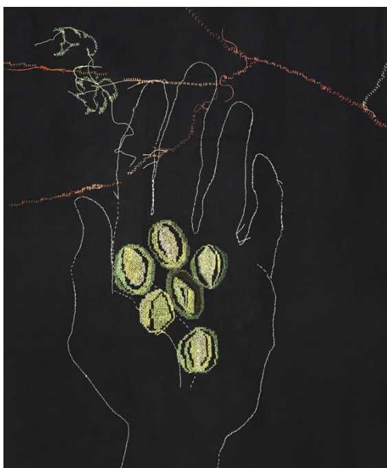
Figure 4. Récits-tentures . Détail. Broderie sur lin, 2020

du tissu (fig. 4). D'un côté, on voit les fruits mûrs tels que remémorés dans le récit passionné de la personne. De l'autre côté est brodée la plante transplantée. Ses branches sont mortes. La broderie est mise en espace de façon à pouvoir en faire le tour. Sur chaque côté du tissu, on voit des points de croix à l'endroit et à l'envers. Le tissu n'a plus de face, n'a plus d'envers. La broderie permet d'exprimer l'idée que cette plante prend racine de l'autre côté de l'étoffe. Le tissu de lin se transforme en lieu. Plus encore, il se transforme en double lieu, lieu d'origine et lieu d'accueil en même temps, où seuls les fils, telles les racines, peuvent sans cesse passer de l'un à l'autre.