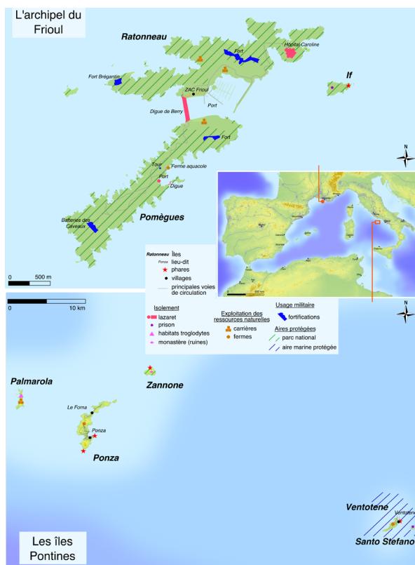
Figure 1. Planche cartographique de l'archipel du Frioul et des îles Pontines (avec mise en évidence des éléments décrits ci-dessus)

Cette présentation succincte des deux archipels dans le temps long met en évidence des usages distincts présents sur ces territoires. De ces usages, il est possible de déduire différentes dynamiques démographiques. Ainsi, certaines n'ont pas été habitées pendant des périodes plus ou moins longues : Ventotene a été désertée pendant le Moyen Âge, les îles de Pomègues et de Ratonneau