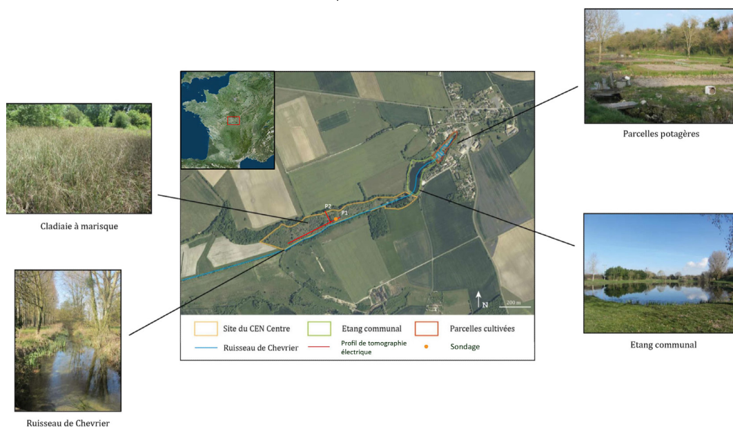
Figure 1. Les différentes unités paysagères du marais de Chavannes et localisation des profils de tomographie électrique et du sondage (d'après Martin, 2014)

Le marais comprend plusieurs entités situées sur le tracé du ruisseau de Chevrier (Martin, 2014). Au plus proche de la source, se trouvent des parcelles cultivées entre lesquelles circule le Chevrier dans un système de fossés mis en place pour drainer cette zone anciennement marécageuse. En aval de cette zone potagère, se trouve l'étang communal de Chavannes créé à l'emplacement d'une ancienne exploitation de tourbe. Enfin, à l'exutoire de l'étang communal se trouve le marais proprement dit.