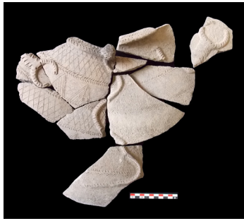
Figure 5. Matériel de l'espace 517 évoquant des pratiques culturelles: motifs chtoniens (Kunara, Chantier C)