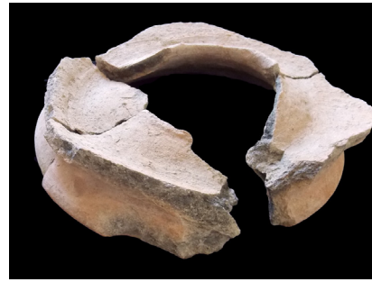
Figure 7. Récipient de mesure (Kunara, Chantier E)

tion artisanale ainsi que le maintien de la cohésion sociale par la pratique culturelle et la centralisation des pouvoirs locaux. Kunara semble donc intégrée dans un territoire qu'elle régit et plus largement dans le réseau d'échange mésopotamien.