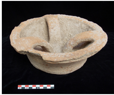
Figure 6. Matériel de l'espace 517 évoquant des pratiques culturelles: Internal Handled Bowl (Kunara, Chantier C)