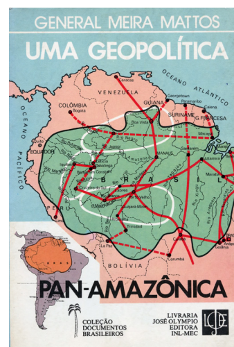
Figure 1. Couverture de l'un des livres du général Meira Mattos

Le général Travassos est encore considéré comme un des inspirateurs de l'armée brésilienne, Golbery a été l'un des créateurs de l'École supérieure de guerre, l'un des architectes du coup d'État militaire de 1964 et le créateur du SNI (Service national d'information), le bras principal de la politique du régime militaire. Meira Mattos a enseigné durant des décennies à l'École du commandement de l'état-major de l'armée. Dans son livre Uma Geopolítica Panamazônica (1980), l'enjeu – la satellisation de toute l'Amazonie, au-delà des frontières du Brésil – et le moyen de l'obtenir – la construction de routes transamazoniennes – sont annoncés dès la couverture (fig. 1).